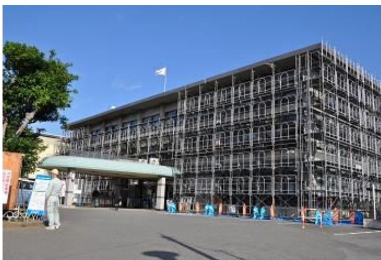
耐震工事中の館山市役所本庁舎