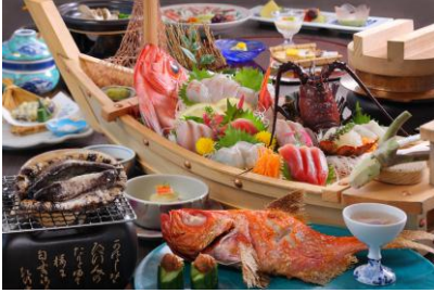
新鮮な山海の幸を季節替わりの献立で