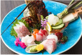
コース料理のほか館山ならではの一品料理もご用意