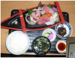
おススメはボードで確認