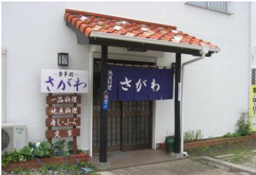
館山駅 西口徒歩3分、北条海岸近くです

アジ、ワラサ、ヒラメ、カワハギ、カマ ス、メバル、サザエ、スズキ、イサキ マトウダイ、米 ほか