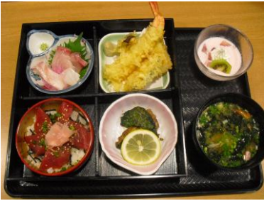
お屋の人気メニュー「海花卉当」はボリューム満点！