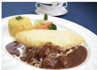
新メニューの「館山オムレツランチ」は館山産の卵をたっぷり使用