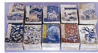
曲亭馬琴作『南総里見八犬伝』