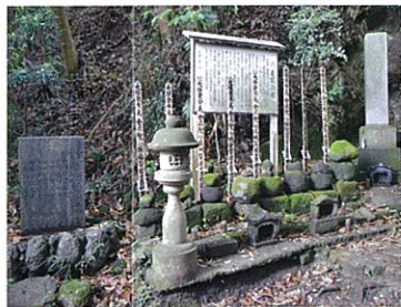
5 八遺臣の墓(ウバガミサマ)

頂上西側斜面にあり、オオムラサキ・ヒラドツツジ・クルメツツジなどの赤・白・しほり約1万本が植えられています。