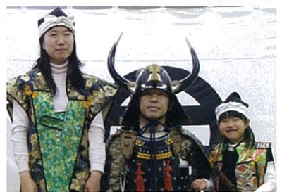
※展示資料は変更することがあります。甲冑を着よう!(日曜・祝日の10時~12時、13時~15時)