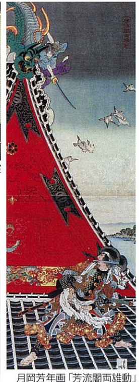
月岡芳年画「芳流閣両雄動」