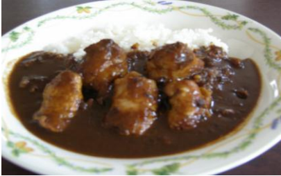
ボリューム満点の「特製どんぐりカレー」