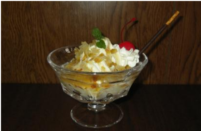
アイデア溢れる[D(どんぐり)級グルメ]が人気です