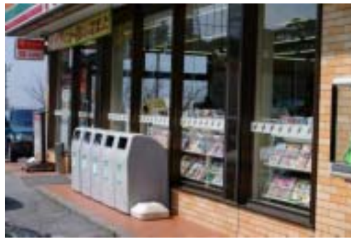
24時間納付ができます

コンビニでの納付 4月以降発行の納付書からコンビニエンスストアでの納付が可能となりました。これにより、休日・夜間にも納付することが出来ます。