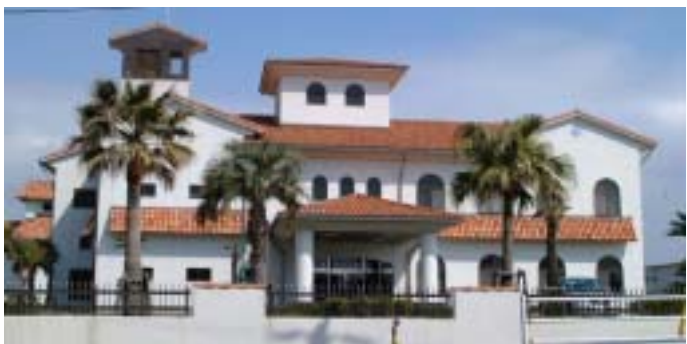
鏡ヶ浦クリーンセンター

今年度、公共下水道が使用 できるようになった区域の土 地所有者などを対象に「受益 者負担金の申告・申請の受付 を行います。