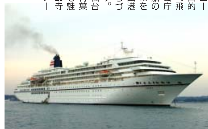
▲館山港に停泊中の飛鳥(昨年3月5日)

市では、観光・レクリエーションの振興を図る、多目的観光棧橋の早期実現と「飛鳥」などの客船・帆船・官公庁船・貨物船など多様な船舶の寄港により経済の活性化を図るとともに、今後も館山港を中心とした「海辺のまちづくり」に取り組んでいます。今回のクルーズでは、仙台にて、伊達政宗ゆかりの青葉城と秋保温泉、松尾芭蕉も魅せられた松島遊覧と瑞巖寺などのオプショナルツアーが予定されています。