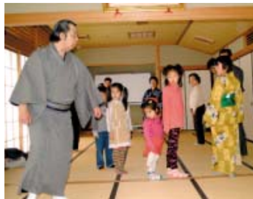
きれいな歩き方を学ぶ