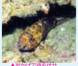
▲岩かげで待ち伏せ