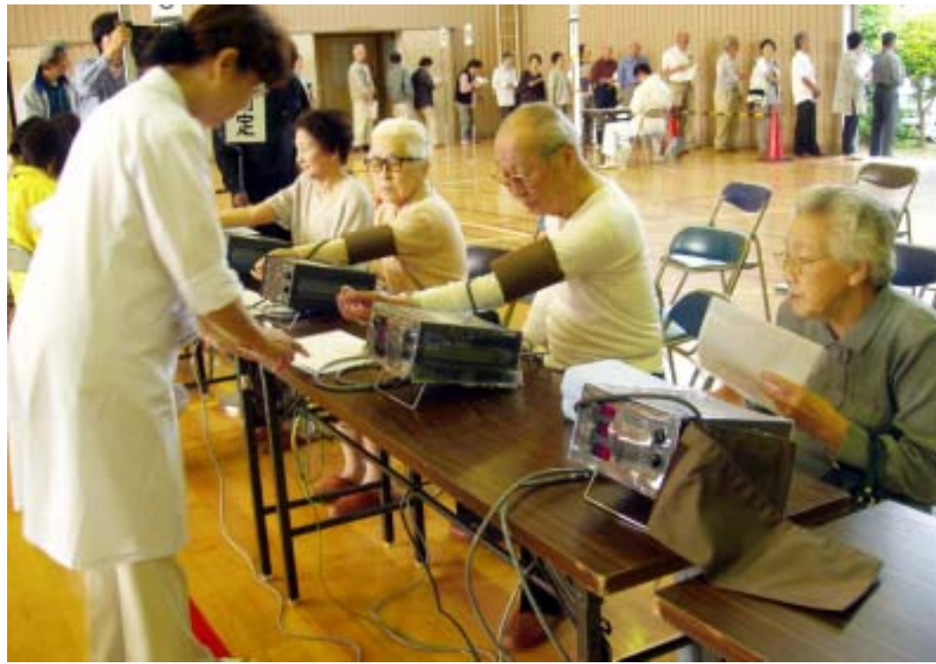
昨年の総合検診のようす

総合検診では、尿検査や身体測定などを行う「基本検査」 尿検査は、痛風などの原因となる尿酸値を検査する「尿酸値検査」