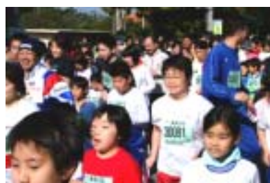
ファミリーの部のスタート

今回の若潮マラソンには、746人の市民の申し込みがあ りました。各組の上位に入った市民は次のとおりです。 また、今年の館山若潮マラソンの結果は、インター ネット( http://www.city.tateyama.chiba.jp/wakasio/w- index.htm )でも公開しています。