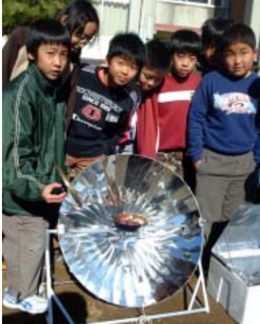
太陽光でお芋も焼けたよ！

総合学習のテーマは「館山の自然を守る」。この一環として、クリーンなエネルギーである新エネルギーを授業に取り入れました。子どもたちは、肌で感じて、理解を深めるので、この事業はありがたいです。これをきっかけに、さらに興味関心を深めてほしいですね」と話していました。