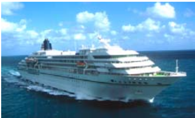
館山に初寄港する客船「飛鳥」

日時/3月5日(水)午前中 内容/テンドーボート(小型船)などで飛鳥へ乗船し、30分程度の船内見学【集合時間や場所などは、当選者のみに連絡します】 対象/中学生以上 定員/20人程度(応募多数)