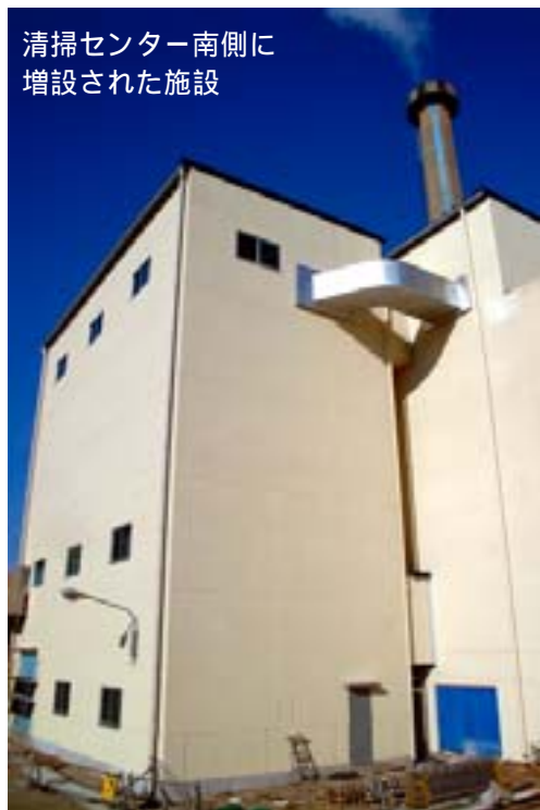
清掃センター南側に増設された施設