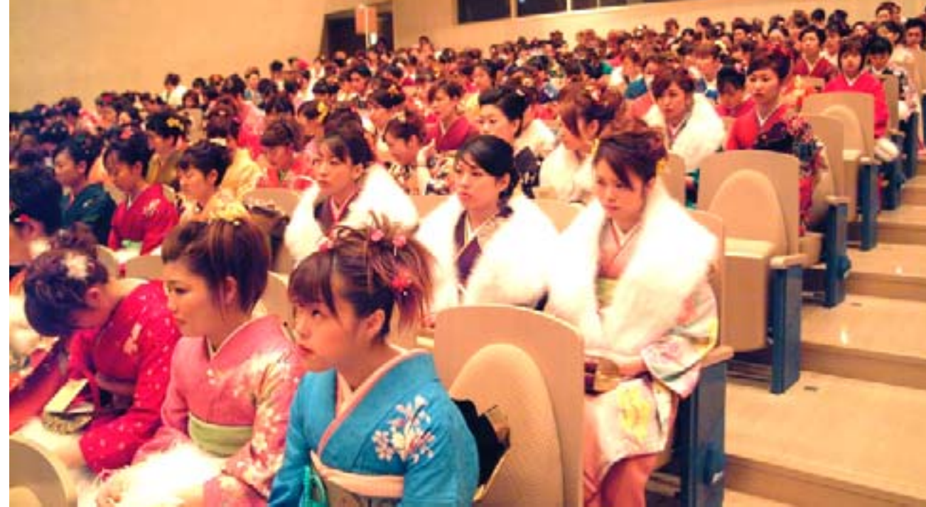
会場に集まった新成人