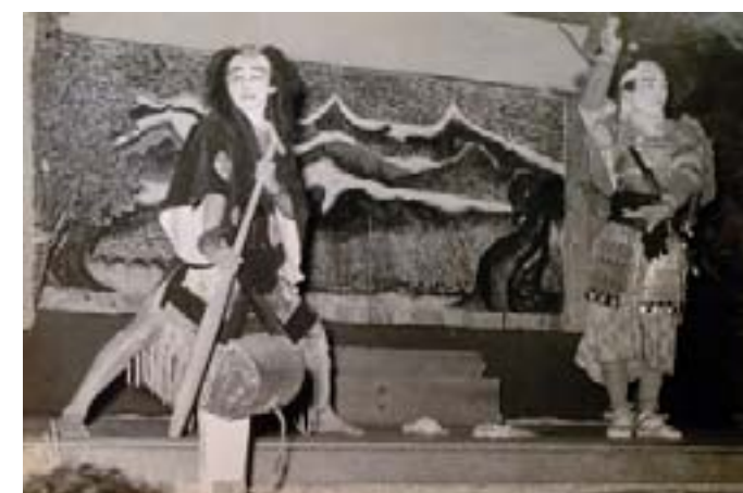
昭和30年代の藤原村歌舞伎