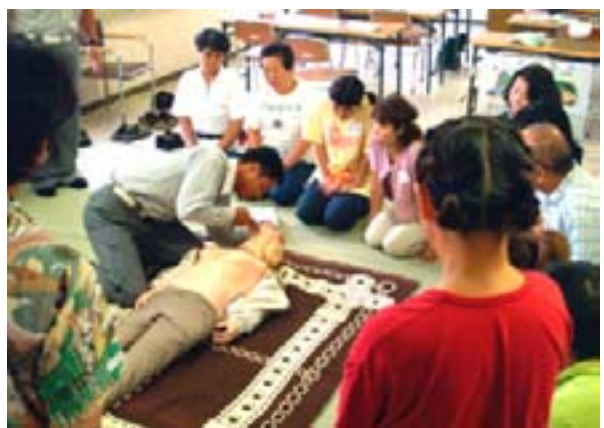
人形を使って、気道の確保

市内で100歳以上の人は、今年の12月31日で12人になる見込みです。市では毎年80歳、88歳、99歳、100歳以上の人に敬老祝金として、同共通商品券を贈呈しています。今年度の対象は、80歳が45人、88歳が25人、99歳が6人、100歳以上が12人、計695人。敬老の日までに祝金を届けました。