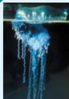
カツオノエボシ(群体)

その昔、太平洋岸の漁村ではこの烏帽子のような形をしたクラゲが黒潮に乗って流れ着くと、「鰐が烏帽子をぬいだ！近くに来たぞ！出漁だ！」と活気づいたという。この言い伝えが名前の由来である。ミズクラゲのような普通のクラゲとは違い、この仲間はクラゲクラゲ類に分類され、房総ではこの他にギンカクラゲやカツオノカンムリがよく見られる種類である。