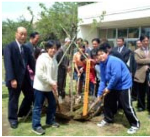
児童といっしょに植樹

先月23日には、塾の設立記念事業として、北条小学校校庭に3mのソメイヨシノの成木を植樹。今後は、児童たちに学校周辺の公園や空き地、河川敷など桜の植樹場所を探してもらいながら、地元住民とワークショップを展開(さくらマップの作成)し、来年度までの計画で活動の輪を広げていきます。