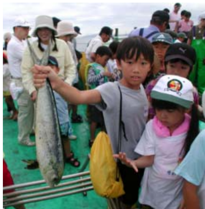
昨年の子育て塾、定置網の様子「大きい魚がとれたよ!」