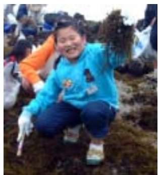
手にいっぱいヒジキをとる児童

この催しは、市内伊戸地区の漁業会の人々が、ヒジキ刈りを通じて、水産業への認識を深めてもらおうと児童たちを招いて行われました。地元の漁師から、靴に滑り止めの荒縄のまき方やヒジキの