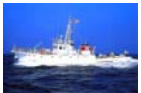
漁業調査船「たか丸」

漁業調査船の中を見よう 漁業調査船「たか丸」の船内見学 時間 / 午前10時から正午、午後1時から午後3時まで 午後1時から午後3時まで 場所 / 案内図 共催 / 水産工学研究所 海の安全を守る海上保安部のコーナー 海の安全を守る活動の紹介など 時間 / 午前10時から正午、午後1時から午後3時まで 協賛 / 千葉海上保安部 場所・共催 / 県立安房博物館【案内図】