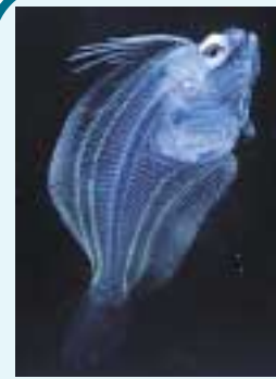
眼が両側にある稚魚(1cm)

「左ヒラメに右カレイ」といわれるが、これは目のついた側を上、腹を手にして置いたとき、頭が左を向くのがヒラメで右を向くのがカレイという意味である。平らな体を良く見るとエイのように上下に平らになったのではなく、左右にうすくなった体を横たえた格好をしている。おまけに頭だけが90度近くねじれ、目が片側に移動してしまっている。泳ぎ方も人間の横泳ぎと似たスタイルである。 普段は数十メートルの深い海の底に住んでいるが、春になると産卵のため浅場に移動するので船釣りの好対象となる。 孵化したばかりの稚魚は中層を泳いで生活する。頭も最初からねじれているわけではない。