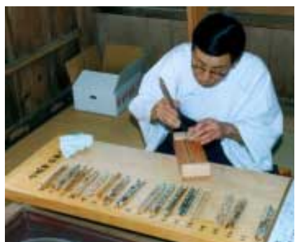
さて、今年の作柄は...