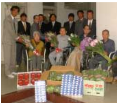
どうぞ！私たちがつくりました

は、今日1日、湊の館山養護老人ホーム（入所者数70人）と館山特別養護老人ホーム（入所者数100人）を訪れ、生産した花や野菜などの農産物を入