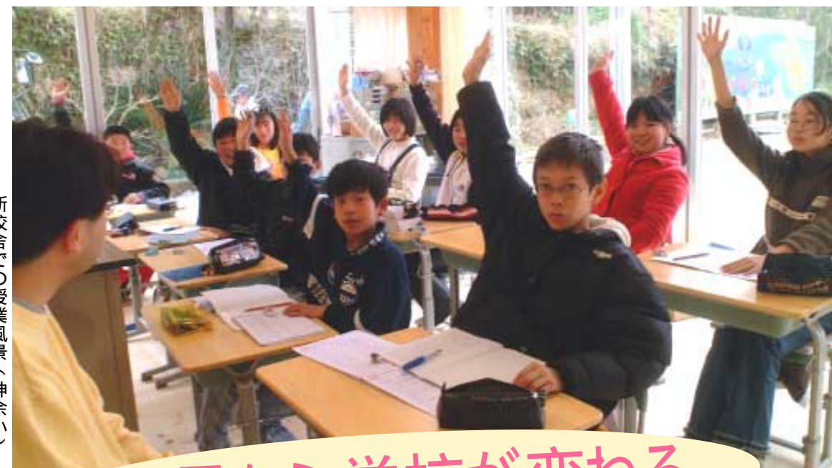
新校舎での授業風景（神余小）