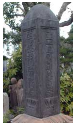
ハンゲル四面石塔 11日間

市内大綱にある浄土宗寺院「大蔵院」には、四面に4種の文字で「ナムアマミダブツ」と刻んである石塔がありま す。この1面には、ハンゲル文字で書かれていることから「ハンゲル四面石塔」とも呼ばれています。 この石塔から江戸時代の