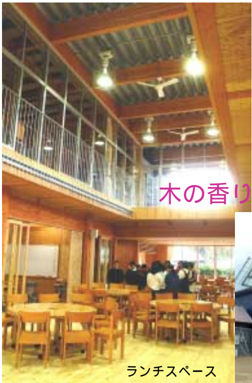
木の香り漂う神余小新校舎

新校舎は、木造2階建て、面積千170㎡、工事費用3億4千860万円。1階教室の内壁が可動間仕切りで、学習に応じて広さを変えることができます。また東西3つずつの教室の間は、ランチス