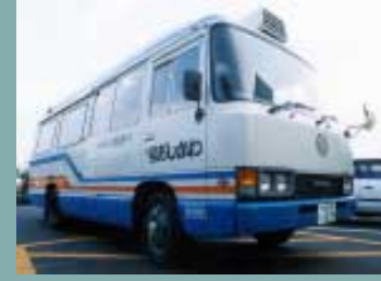
問合せ/館山市図書館 ☎22-0701