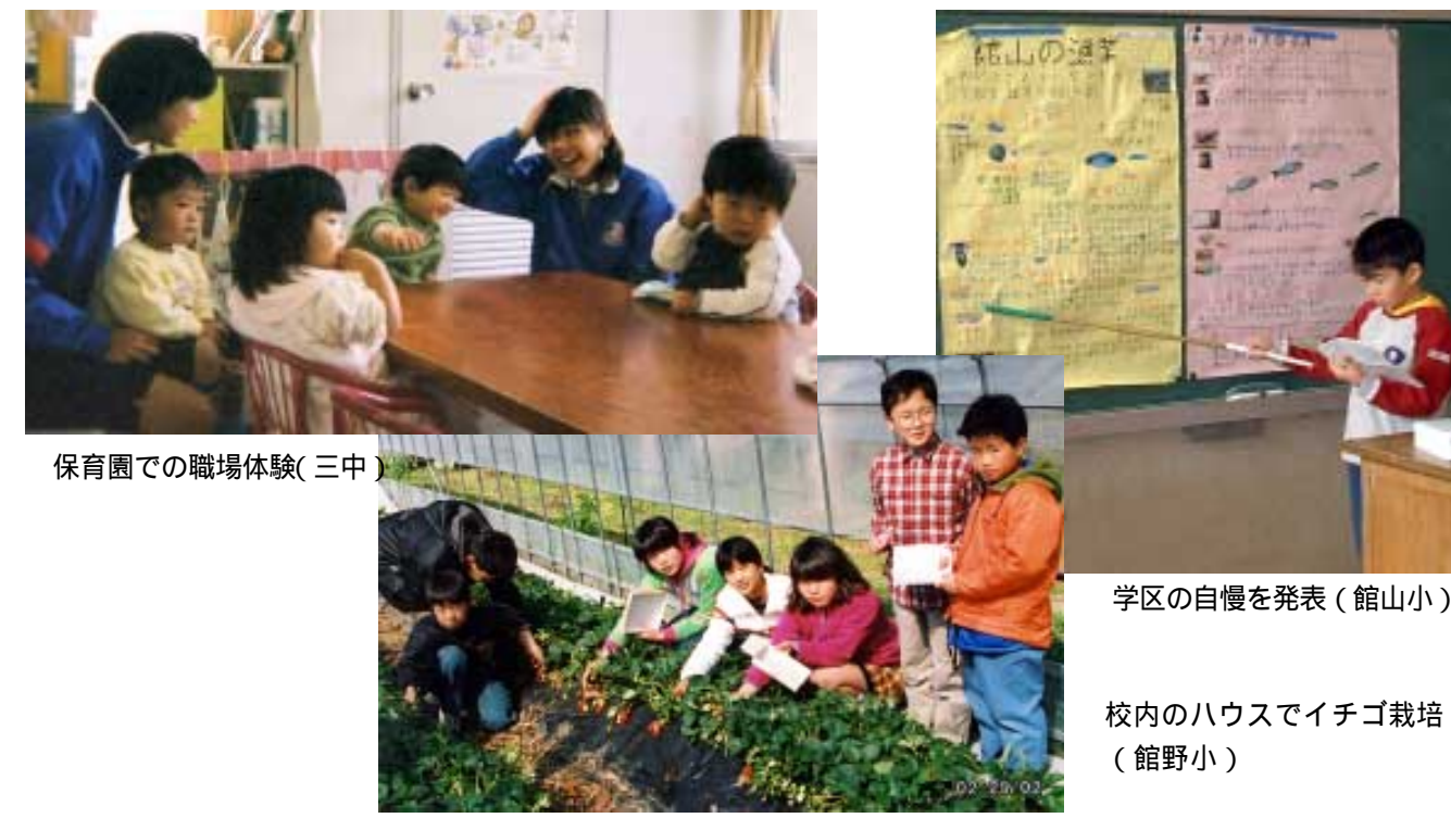
保育園での職場体験(三中)

紹介していますが、これさらに充実させる方向です。例えば、これまで小学校低学年を対象に行っていた図書館の「子どもお話し会」の中に、高学年を対象とした「文学講座」を加えたり、理科や図工などの分野で、学校では体験が難しい公民館プログラム（仮称子ども文化サークル）の創設などを検討していきます。各社会教育施設では、事業の見直しと新規事業を計画していますが、翌月のプログラムをだん暖たてやまの毎月15日号でお知らせしていきます。また、館山子どもセンターが発行する情報誌「きらきらキッズたてやま」（年4回発行）や市ホームページでも、イベント情報や特色ある活動を紹介していきます。 問合せ/生涯学習課（☎22 3698）