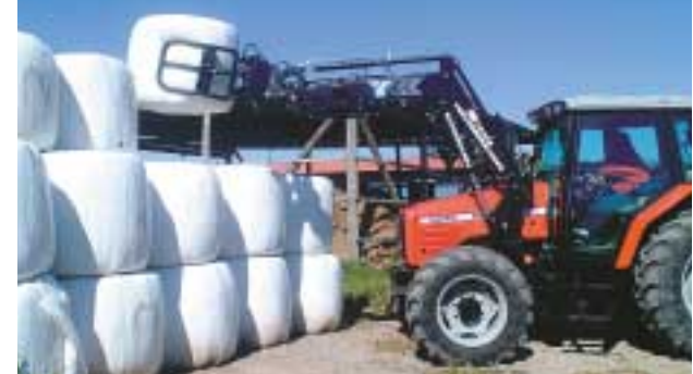
トラクターでラップしたエサを移動

この組合では、那古、高井地区で2反以上の基盤整備された水田を探している。 問合せ / 農水産課農政係 員会 ( ☎ 22 3396 )、農業委員 ( ☎ 22 3539 )