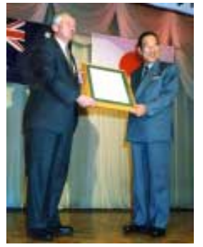
昨年4月ポ市長に特別名誉市民証が贈られた

友好都市オーストラリアのポトステイプンスから来月、約30人が友好を深めに来てくれます。館山国際交流協会では、この期間中、ホームステイを受け入れるホストファミリーを募集します。 期間/4月13日(土)~17日(水) 4泊 日時/4月7日(日) 午前10時から午後3時 場所/雁月庵(城山公園) *野点あり、無料 問合せ/生涯学習課文化係 (☎22 3698) 募集家族/10軒(応募多数の場合は選考) 受入れ人数/1家庭に1人ないし2人 条件/1部屋を提供できる、英会話が多少できる、朝夕指定の場所に車で送迎できる、ゲストといっしょに行事に参加できる、できればシャワー、洋式トイレが