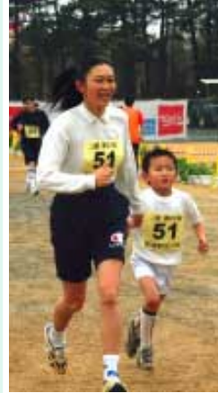
お母さんといっしょにゴール