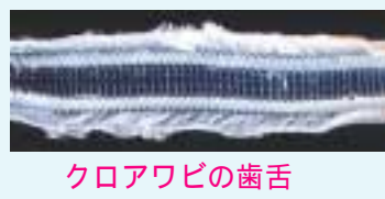
クロアワビの歯舌

大潮の磯に出た時、岩肌に残された不思議な模様に気づくことがある。初めて見たときから貝の食み跡であることは想像できたが、その主にはなかなかお目に掛かる機会がなかった。昼間の磯に何度足を運んでも食事の貝が見つからないのである。ある時、夜の磯に出かけてみた。その時撮影できたのがこのマツバガイの写真である。カサガイが干潮時に這いまわるとは思ってもいなかったので、意外な発見であった。潮が引いた磯でも夜であれば岩肌が乾かないので、貝も這う事ができるのである。