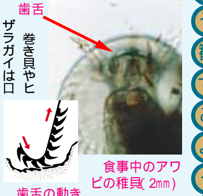
食事中的アワビの稚貝(2mm) 歯舌の動き