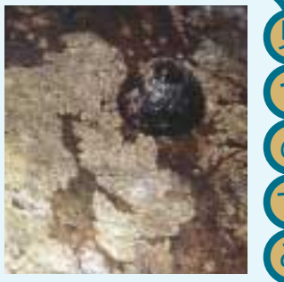
マツバガイと食み跡