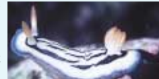
リュウモンイロウミウシ