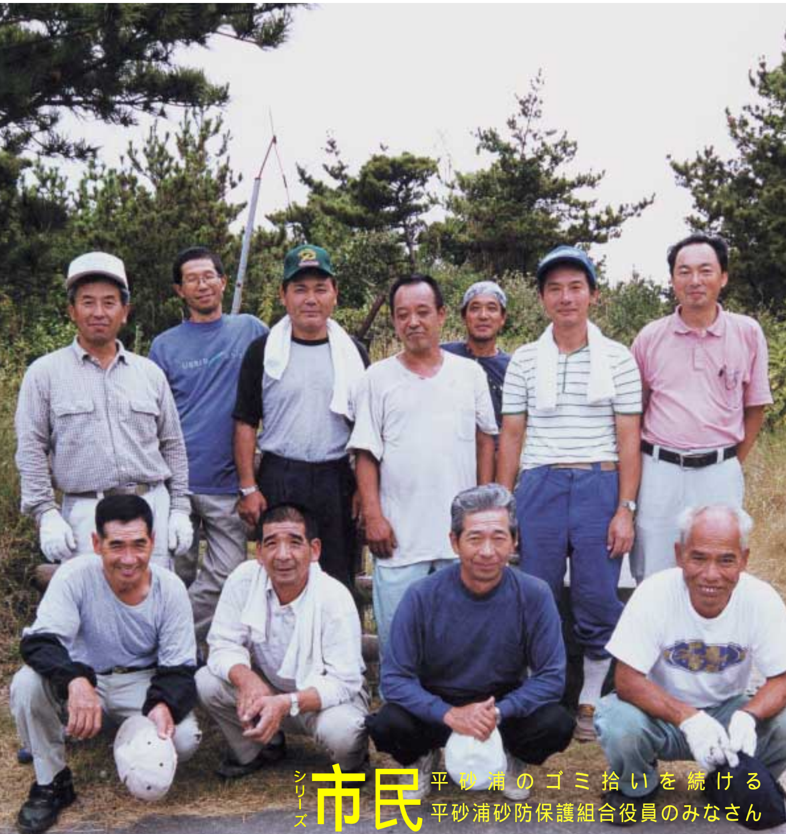
シリーズ 市民 平砂浦のゴミ拾いを続ける 平砂浦砂防保護組合役員のみなさん