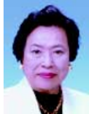
パネリスト 堂本 曉子 千葉県知事

時間/13時40分〜15時 テーマ/「歴史と文化に生きるまち」今こそ語ろう里見氏