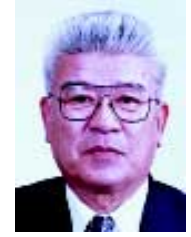
パネリスト 早川 芳忠 倉吉市長(鳥取県)