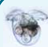
殻をもつ幼生 無防備な体をまずい味に作り変え

2本の触覚を振り立てて歩く姿が牛に似ているのだからか？しかし、牛というイメージには体が余りにも小さすぎる。英名は「海の名メカジ」を意味する「シー・スラッグ」であるが、この方が実態に合っているように思える。数センチ程度の小形種がほとんどで、小さいながらそれぞれ鮮やかな原色で彩られている。貝殻をすててしまった彼らも、巻貝である証拠に幼生期には巻いた殻を持っているのである。