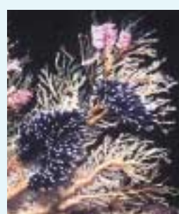
スミソメミノウミウシと卵塊