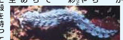
ムカデミノウミウシ