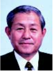
パネリスト 石井 清一 榛名町長(群馬県)