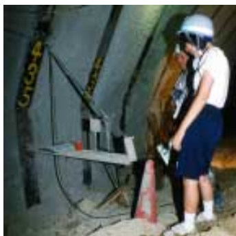
丹生第2トンネル内レーザー光線で方向を決めている