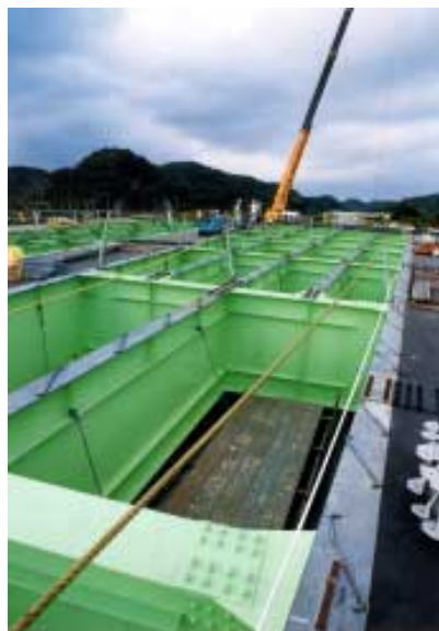
（仮称）富浦インターの橋脚