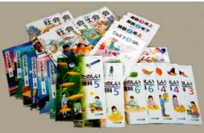
採択された小学校の教科書

代表、保護者の代表が委員として選出されています。採択地区協議会では、教科用図書専門調査員を委嘱し、専門的事項について、調査研究を依頼します。調査員の調査結果を参考に審議し、安房管内の各小中学校で使用する教科書として、ふさわしい教科書を選定し、各市町村教育委員会に通知します。各市町村教育委員会では、採択地区協議会の審議結果を