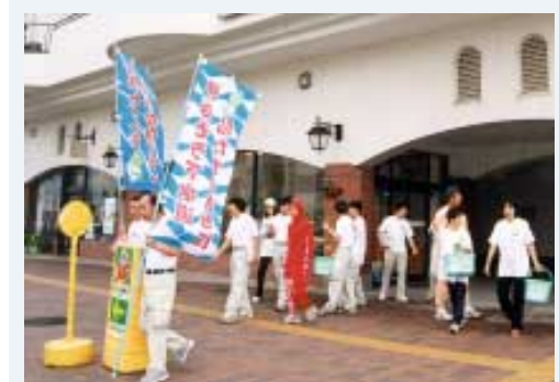
下水道の日「街頭キャンペーン」(昨年)

市では、公共下水道が供用開始された区域の一般家庭や事業所に対して、トイレを改造した場合に補助金を助成しています。補助金を受けられる期間は、供用開始後3年以内ですので、平成11年4月1