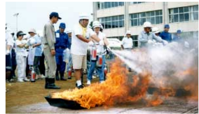
昨年の初期消火訓練

当日は午前6時に防災行政無線と消防団車両が、東海地震警戒宣言広報訓練として、全市一斉にサイレンを鳴らし、えんえんと間違った。火災など間違えなくてください。問合せ/社会安