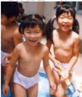
那古幼稚園のお友だち

市立幼稚園では、幼稚園の雰囲気を感じてもらおうと入園前（3歳児）の子どもや保護者を対象に「ちびっ子デー」を設けています。子育てや幼稚園に関する質問や相談も応じています。