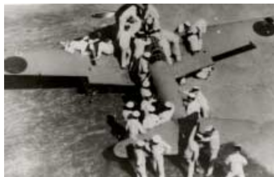
洲ノ崎海軍航空隊整備学生兵器搭載訓練

あの日あの時 市民が直接体験した歴史や文化にかかわる事柄を後世に伝えるよう、市民から情報を募り、体系的に整理して、デジタル情報として取りまとめます。さらに体験者の話しを聞き取って、とりまとめる人材養成の講座も開催の予定です。