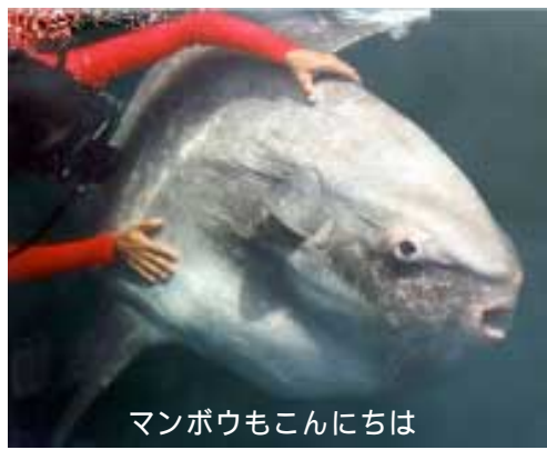
マンボウもこんにちは

「こつちに来たぞー！でかい、でかい」波左間漁業協同組合が主催するマンタ見学会が、波左間漁港で行なわれまし。見学日初日の今月3日には、20人の小学生が参加。潮流が早く、定置網が引き上げられず、予定していた魚の水揚げ作業見学はできませんでしたが、お目当てのマンタを見に、沖合いのいけすに漁船で出港。目の前で泳ぐ、大きなエイに「うわーでかい」と大喜び！同じいけすにいるマンボウも顔をだし、子ども達にはしゃいでいました。「マンタを見て興奮しまし