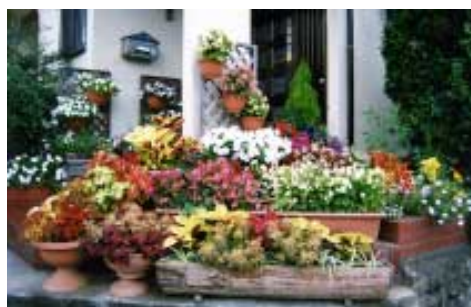
花・ガーデニング教室日程表

日時/日程表のとおり 場所/コミュニティセンター 定員/40人(過去に受講していない人優先。応募多数の場合は抽選) 参加費/材料費、傷害保険料など全回で1万円程度 締切/8月20日(月) 申込み・問合せ/中央公民館(☎23 3111)