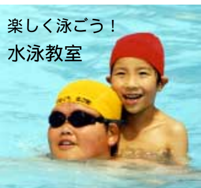
楽しく泳ごう! 水泳教室

下水道への理解を深めるよう、市内の小中学生を対象に下水道標語を募集しています。夏休み前に学校を通じて、児童、生徒にチラシを配ってあります。結果は10月1日号でお知らせします。