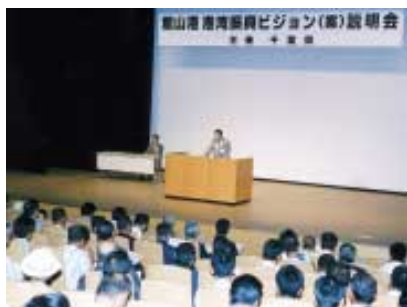
館山港港湾振興ビジョン説明会

先月18日、千葉県主催の「館山港港湾振興ビジョン(案)」の説明会が南総文化ホールで行われました。このビジョン(案)は、館山港が平成12年5月に観光・レクリ