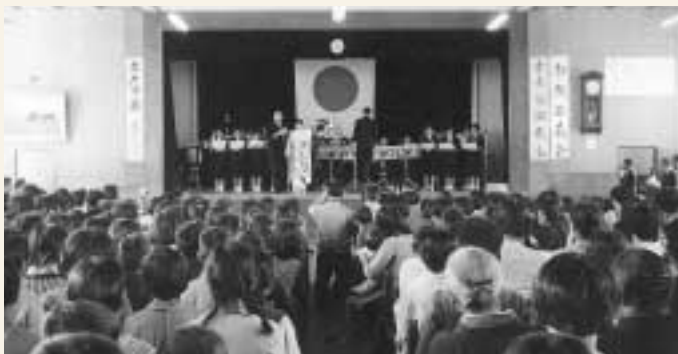
市歌「わが町館山」の発表会(昭和35年)

今日学校教育と並んで、社会教育が定着していますが、以前は学校を卒業すると同時に勉強も卒業するという考えが一般的でした。