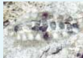
ヒメケハダヒザラガイ