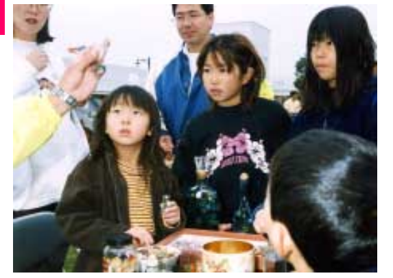
去年の子どもフェスティバルの1コマ

「たてやま子ども市民大学」は、市内の小学生が対象です。 自分の好きな教室に参加して「はっけん伝カード」にスタンプをためていくだけ。学校で配られる1年間の学習プログラムや毎月15日号の「だん暖たてやま」を見て、好きな講座に参加しちゃう。 カードにスタンプが50個たまったら、生涯学習課や中央公民館などの施設にカードを提出してください。 修了者には、大学長(市長)から「たてやま子ども博士賞」と「博士メダル」をさしあげます。 問合せ/生涯学習課 ☎22-3111 内線662