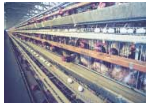
100m先まで鶏がズラリ

す。台風などの時は泊り込みで対応しています。生き物相手ですから、365日正月もお盆もありません。 共進会では形や殻のキメなどの外観が30点、黄身の色や白身の盛り上がり具合などの内容が70点の100点満点で審査されます。外観は分かりませんが、内容は卵を割ってみないと分かりません。97・1点の高得点が採れたのもみんなの努力と地元神余地区の皆さんの協力があったからだと感謝しています。 畜産業界もコストや輸入攻勢など年毎に厳しくなっていますが、他の農産物に比べれば国際競争力がある方です。卵を生で食べるのは日本人だ