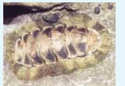
ヒザラガイ(爺が背)

彼らはカサガイと同様に家を持ち、潮が満ちると這い廻って珪藻などの餌を食べ、やがてもとの家に戻っていく。ババガセは肉食性の variability で、足の前部を少し浮かせて静止し、知らずに潜り込んでくるヨコエビなどを捕らえて食べるのである。 沢山の個体が集まる場所では、留守の家を巡って縄張り争いなども起こるらしい。春の磯に出て彼らの行動を観察してみよう。(小池康之)