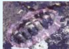
ニシキヒザラガイ