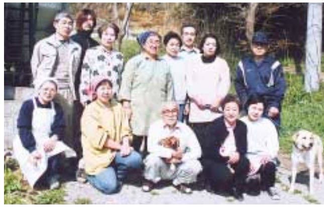
宮本養鶏の皆さん

父が養鶏をしていたので、高校を卒業してすぐに始めました。2年後に弟も加わり、生産、販売の両輪で働くようになり、40年になります。卵1個の値段は当時から10円、20円で今も変わりません。豆腐や納豆と同じ値段だったと思います。当時の床屋代が150円でしたから、物価の優等生ですね。その分、コストを下げるのは大変です。