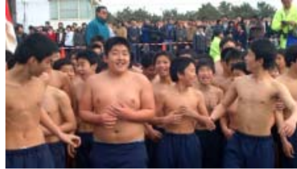
入水前の中学生(昨年)

「第57回館山湾寒中水泳大会」の参加者を募集します。市外からも参加できます。 期日/1月17日(土) 受付/午前11時30分 水泳開始/1回目午後1時20分、2回目午後1時50分 会場/三軒町無料休憩所前 参加資格/中学生以上で、寒中水泳に耐えられる人。医師の健康診断(中高生は、定期健康診断など)を受け、健康上指摘を受けていない人。中高生は保護者の許可要。 定員/千人