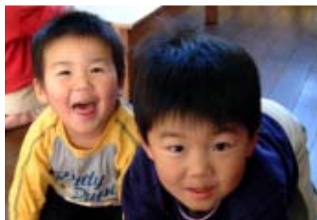
純真保育園のおもだち

来月4月から入園する保育園児の受け付けを行います。対象/保護者の労働や疾病などで、家庭で保育できない