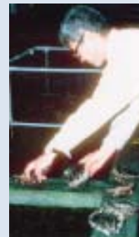
▲親貝の選別 (旧水産試験場)