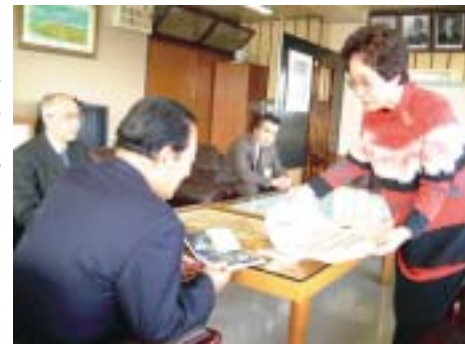
市長に受賞の報告をする2人(先月27日)

とき/2月8日(日)午後1時30分開場、2時開演 ところ/南総文化ホール(小ホール) 曲目/序奏と Rond op.98(クーラウ)、チェロ組曲第1番(J.S.バッハ)、ロマンス(モリコーネ)など 料金/一般3,500円(安房郡内小中高校生は無料) 前売券/南総文化ホール、松田屋楽器店、カミヤマ、館山駅前観光案内所、宮沢書店 問合せ/館山音楽鑑賞協会事務局(生涯学習課内) ☎22-3698