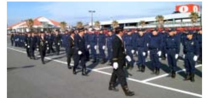
服装点検の観閲(昨年)

市消防団では、1月7日(水)に消防出初式を行います。 消防団員の表彰や分列行進、服装点検の観閲、消防車による放水など日頃の訓練成果を披露します。 当日は、市民の見学もできます。 日時/1月7日(水) 9:00～12:00 会場/南総文化ホール 問合せ/社会安全対策課 (☎22-3442)