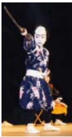
一昨年の南総発見フォーラムで演じた鳥取県関金町の子ども歌舞伎

日時／1月24日、2月14日、28日、3月13日、20日、27日(いずれも土曜)