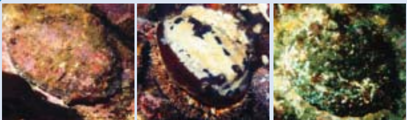
▲流れ藻を捉えるメガイアワビ ▲行動的なクロアワビ ▲深場に住むマダカアワビ

アワビ類は藻食性の巻貝で、日本に10種類が生息する。北海道から東北にはエゾアワビが、それ以南にはメガイ・クロ・マダカアワビの大形3種類、また、中部以南にはトコブシとフクトコブシが住む。これら産業的に重要な6種類の他に、暖海域に小型の4種類が知られているが、漁獲対象にはされていない。房州で主に漁獲されるのはクロ・メガイ・マダカの3種類であるが、種類毎にそ