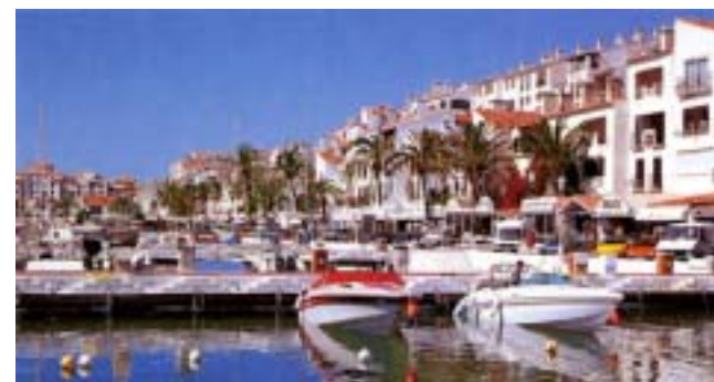
アンダルシア地方の港と街並み

今回、次の日程で調査報告会を開催します。 日時/11月28日(金)午後4時～ 場所/館山商工会議所(館山市八幡821) 入場/無料 問合せ/海辺のまちづくり推進課 TEL.22-3606