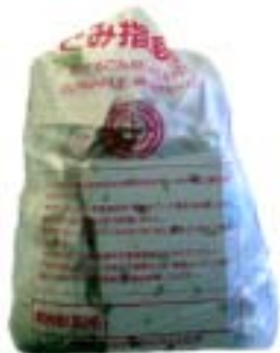
指定袋の導入で、ごみの搬出量も減った。

市では、平成13年9月に「館山市行政改革3ヶ年計画」を策定し、簡素で効率的な行政システムの確立をめざして、単年度で実施することが難しい長期的な改革に取り組んでいきました。今回、計画の2年目にあたる「14年度の取組結果」がまとまりました。81の当初計画に新たに5項目の新規計画を追加し、効果として、昨年度だけで、総額2億3千993万円の節減が実現しました。