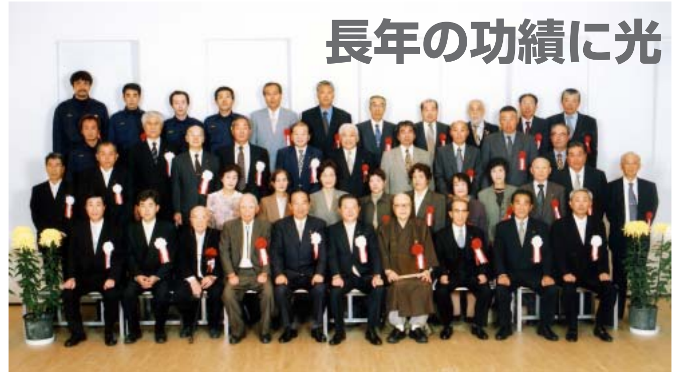
表彰式に出席したみなさん