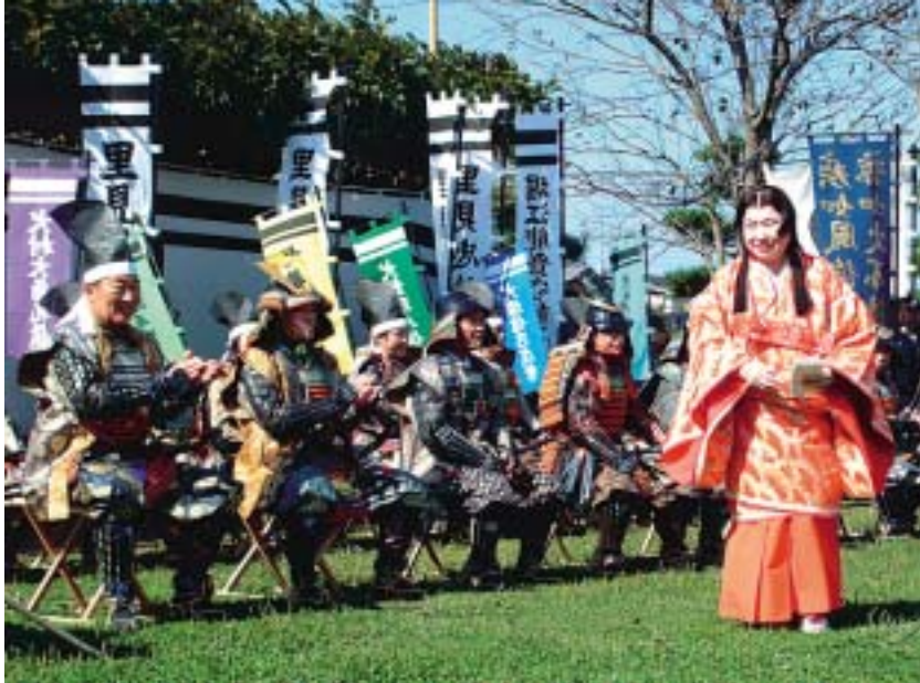
城山での出陣式で挨拶する堂本知事