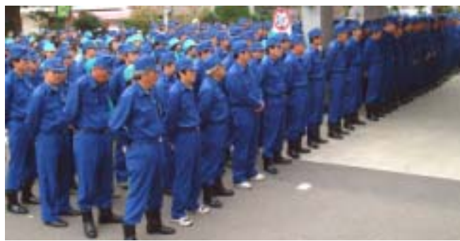
訓練には409人の職員が参加