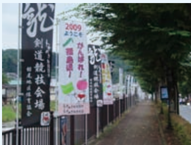
▲会場周辺の歓迎のぼり旗

競技会場には長岡市内の小学生による歓迎のぼり旗が掲げられ、おもてなしの花（プランター）で選手や監督、応援に来られた方々を温かく迎えていました。