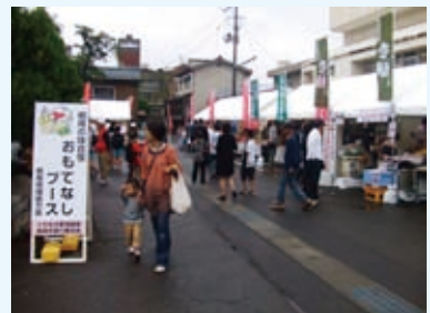
▲地元産品やお土産販売のテント

ゆめ半島千葉国体館山市実行委員会（館山市教育委員会 国体推進課内） 〒294-8601 館山市北条1145-1 ☎22-3957 FAX:23-3115