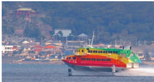
▲季節運航が決まった高速ジェット船

東京～館山～大島～下田航路は、平成18年早春の就航を皮切りに今回で5期目。短時間の移動が可能であることや、早春の南房総のポピーや菜の花、大島の椿、伊豆の河津桜やみなみの桜と、花をテーマとした「海のフラワーライン」の旅を売り物にしています。