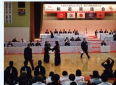
▲試合風景（少年男子：千葉県対熊本県）

は少年男子・女子の準決勝・決勝戦と成年男子の1・2回戦、3日目は成年男子2回戦から決勝戦が行われました。千葉県チームは、成年男子・女子、少年男子の3種別に出場しました。結果は、成年男子・少年男子がともに1回戦で熊本県と対戦、成年女子は1回戦で香川県と対戦しましたが惜しくも敗退しました。来年の地元千葉国体での活躍を期待しています。