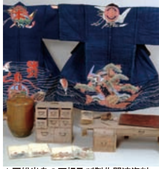
▲房総半島の万祝及び製作関連資料

今回の展示では、県指定有形民俗文化財「房総半島の万祝及び製作関連資料」に指定されている1千403点の資料の中から、万祝とそ