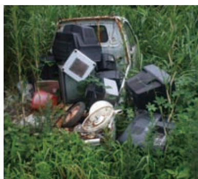
▲不法投棄の現場 (西川名)

分自身です。不法投棄を予防するためには、 ①こまめに草刈りを行い、見通しのよいきれいな状態にしておく。 ②柵を設置する。土のうを積む。入口に鍵を設ける。 ③定期的に見回りをし、常に土地の状態を把握しておく。 など、不法投棄しにくい環境を作ることが大切です。