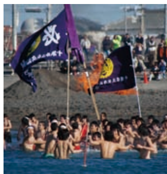
▲今年の寒中水泳大会

日時／1月16日(土) 受付 午前11時30分～、開会式午後1時～、水泳午後1時30分～ ※風雨・荒天などの場合は中止します。当日午前10時まで に決定しますので、電話で確認してください。 場所／北条海岸(三軒町無料休憩所前) 参加資格／中学生以上で、寒中水泳に耐えられる人。医師の健康診断(中学生については学校医による健康診断など)を受け、健康上指摘を受けていない人。大会参加申込書(誓約書)に同意し、提出した人。 ※中高生については保護者の同意が必要です。 定員／500人程度 参加費／100円(保険料など。当日徴収) 申込方法／【中高生】各学校を通じて申し込んでください。【一般人】電話で事前連絡の上、申込書に必要事項を記入して提出してください。【一般団体】申込書に必要事項を記入して集計表を添え、一括して申し込んでください。 申し込み・問合せ／〒294-8601 北条1-45-1 スポーツ課(☎22-3696、FAX23-3115) ※事前申し込みのない人は参加できません。 申込締切／1月7日(木) 注意／写真などの撮影は、報道関係者や大会スタッフを除き一切禁止します。