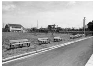
昭和47 館山中央公園開設