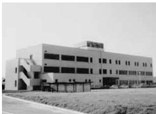
昭和58 コミュニティセンター開館

47年 2月 館山市教育放送センター完成 48年 4月 館山市図書館新築移転 49年 4月 館山市消防署、安房郡市広域市町村圏事務組合に移管 50年 6月 館山市中央公園開設 51年 7月 特急ささなみ開通 52年 9月 館山市老人憲章制定 53年 5月 山梨県石和町と姉妹都市締結 54年 9月 第28回国民体育大会(若潮国体)千葉県で開催 55年 10月 夏季大会(ソト会場)となる 56年 10月 秋季大会(市内会場)となる 57年 10月 剣道会場(市民センター)となる 58年 6月 福祉都市宣言 59年 9月 館山市環境保全公社設立 60年 10月 館山市基本構想制定