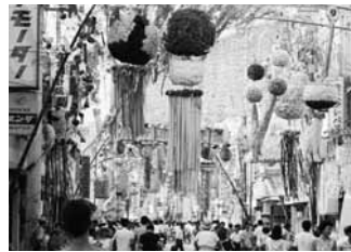
昭和41 七夕まつり(館山銀座商店街)