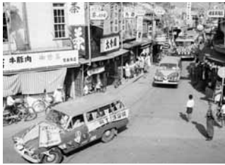
昭和33 夏のカーニバル(館山駅前)