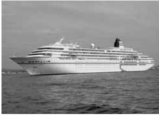
平成15 客船「飛鳥」初寄港