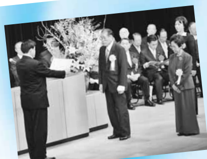
▲名誉市民証の贈呈