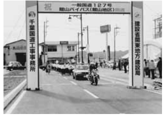
平成4 127号館山バイパス(館山地区)開通