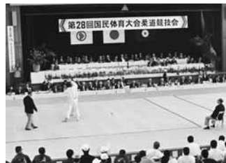
昭和48 第28回国民体育大会開催