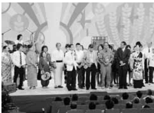
平成21 「NHKのど自慢」開催