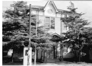
昭和14 市制施行当時の旧市庁舎(昭和35年撮影)