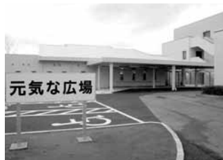
平成21 「元気な広場」開設