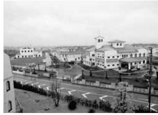
平成10 鏡ヶ浦クリーンセンター通水開始