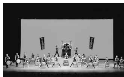
▲「黒潮太鼓」の演奏を行う館山百合幼稚園合奏団

式典では、名誉市民証の贈呈の後、特別功勞表彰者133名と表彰条例表彰者26名のそれぞれの代表者への表彰状の贈呈、表彰者代表からの謝辞に続き、多くの来賓の皆様から祝辞をいただきました。 式典の後半では、前日に「姉妹都市」の締結を行った、オーストラリアニューサウスウェールズ州ポートステイブンス市に対し、館山市から友好盾が、ポートステイブンス市から館山市には記念品が手渡され、今後の更なる交流を確認しました。 また、閉式後のレセプションでは、館山百合幼稚園合奏団30名の演奏による、勇壮な黒潮太鼓が披露され、式典に華を添えました。