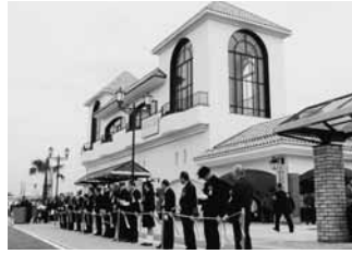
平成11 館山駅橋上駅舎・自由通路完成