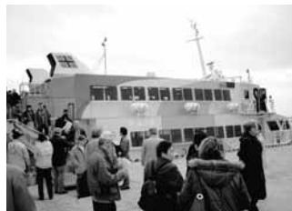
平成18 超高速ジェット船運航