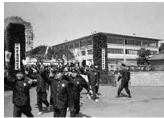
昭和35 市制施行20周年・新庁舎落成記念

58年 11月 館山市コミュニティセンター開館 59年 4月 館山市立博物館(分館)開館 60年 10月 館山市立博物館(本館)開館 61年 10月 西岬市民体育館開設 62年 10月 豊津地区学習等共用施設開設 63年 11月 出野尾老人福祉センター竣工 64年 11月 立館山運動公園開園