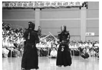
平成17 第52回全国高等学校剣道大会開催