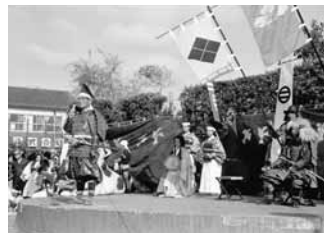
昭和57 第1回城まつり開催(中央公園)