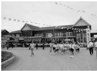
昭和44 房総西線電化開通