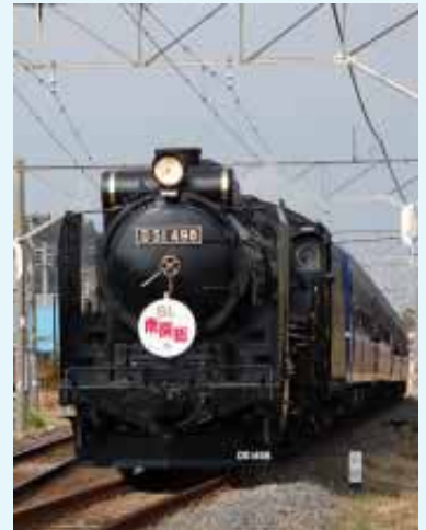
▲今年、房州路を走ったD51

今年、2月から4月に開催された「ちばデスティネーションキャンペーン」に続き、平成20年1月から3月までの期間でJR東日本千葉支社、千葉県等の連携による観光キャンペーン「早春ちばめぐり・房総発見伝春」が開催されます。館山市では、同キャンペーンと合わせ、南房総4市町との連携による「花旅・南房総キャンペーン」を実施します。