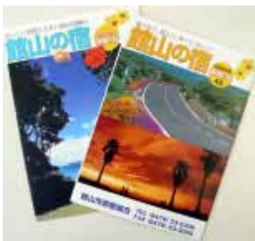
▲館山市旅館組合のパンフレット