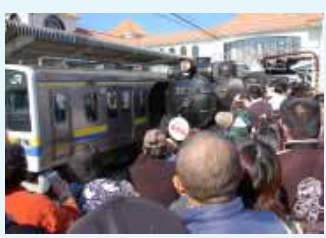
▲大勢のSLファンで大混雑した館山駅（今年1月撮影）

JR東日本では、キャンペーン期間中、「おいでよ房総春！発見」と題し、様々なイベント列車を運行します。1月下旬には、館山駅～勝浦駅間でSL（D51）が運行されます。運行期間中には、館山駅前朝市を開催します。早春の南房総を走るSLの雄姿をお楽しみください。