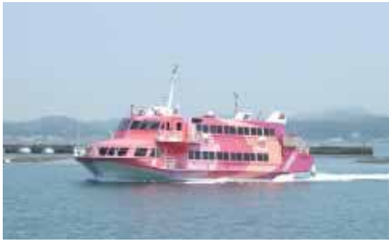
▲2月から運航する超高速ジェット船

平成20年2月2日から3月30日まで、東海汽船(株)の超高速ジェット船「セブニアランド」が、東京・館山・大島・下田間を季節運航します。