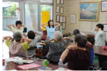
▲たんぼぼの会でヨガの指導

「ヨガなどの指導を必要としている人と健康で誰かの役に立てる人をつなぐネットワーク作りをしていきたい」と今後の抱負を語っています。