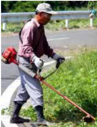
▲草刈りをする会員

なります。1歳以上から入場券が必要です。 ※応募の際に取得した情報は、抽選結果の連絡のほか、番組やイベントの案内、受付料のお願いに使用する場合があります。 申込先 ／〒294-8601 館山市北条1-45-1 企画課「NHK BS日本のうた」観覧係 締切 ／11月12日（月）必着 問合せ ／NHK千葉放送局（平日午前10時～午後6時、☎043-227-7311）、企画課（☎22-3147）