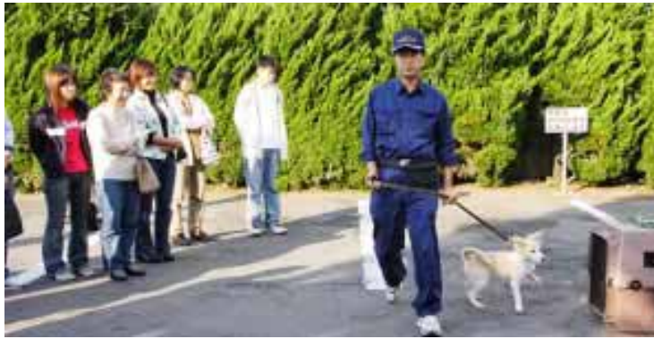
▲昨年行われた「犬のしつけ方教室」