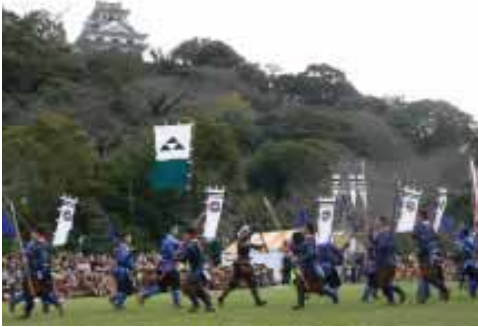
▲戦国合戦絵巻 (昨年撮影)

JR館山駅と鶴谷八幡宮を出発した各隊が、メイン会場の城山公園までパレードします。城山公園に集結後は、戦