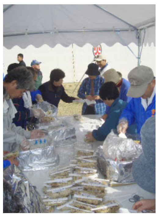
▲炊出訓練の様子(堂ノ下区)

現在、市の自主防災会結成率は71%で、平常時は防災の講習会、訓練の実施、危険箇所、避難場所の把握、避難ルートや防災器材の点検などを行い、災害に備えています。