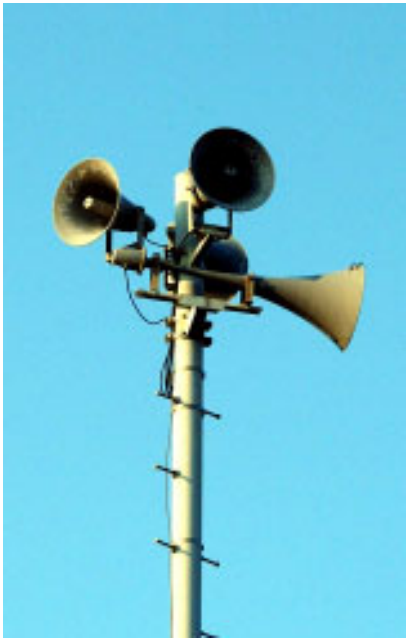
▲デジタル化を進めている防災行政無線システム