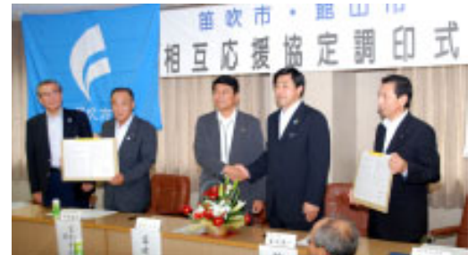
▲館吹市と災害協定締結(7月)

館山を訪れる人たちに「安全・安心」が与えられるように、今後も各種災害協定の締結を推進して行きます。