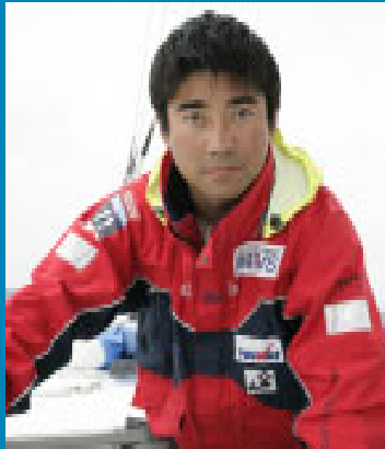
▲海洋冒険家 白石康次郎さん

世界一過酷なヨットレース「5 OCEANS」に参戦し、見事第2位の成績を収めた海洋冒険家の白石康次郎さん。白石さんが、自らの体験を通して夢を追うこと、挑戦するために努力することの大切さについて語るトークショーが開催されます。