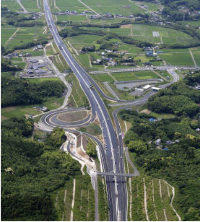
▲7月に全線開通した館山自動車道(君津IC周辺)

○東関東自動車道館山線の一部である館山自動車道において、現在暫定2車線となっている区間の早期4車線化。 ○地域高規格道路館山・鴨川道路を視野に入れた高速道路のネットワーク化を図る