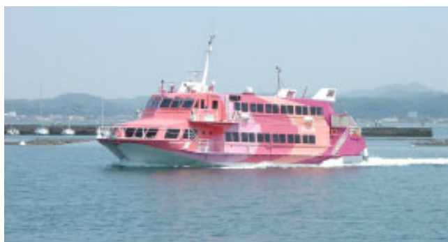
▲来春の季節運航が決まった超高速ジェット船