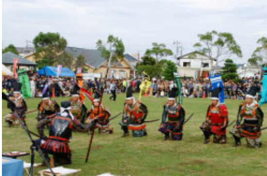
▲武者行列に参加した八犬士(昨年撮影)