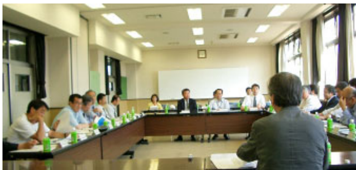
▲渚の駅づくり検討委員会