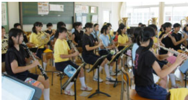
▲猛暑の中、毎日取り組む基礎練習

部員数は41人。コンクールには規定で35人しか出場できませんでしたが、部のスローガン「音の和こそ人の和」の和こそ音の和」を実践し、平成17年以来2年ぶりの金賞受賞につながりました。