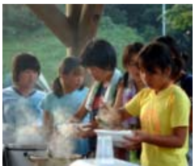
夕飯の支度をする子どもたち