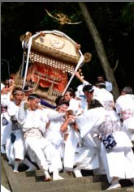
ただでさえ足がすくみそうな急斜面を神輿をかついでかけおろる