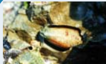
殻に合わせた穴をあける