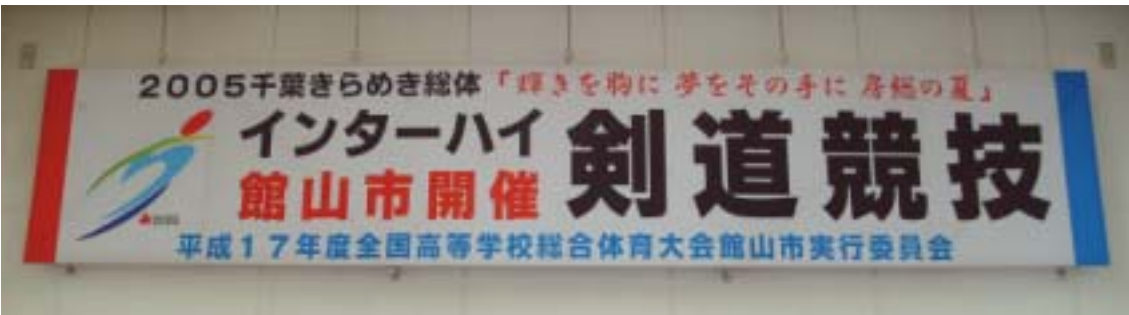
館山駅西口の階段上には2年後の大会に向け看板も設置された

また、高校生の夢舞台にふさわしい若さと情熱ある大会をめざして、「一人一役活動」が展開されます。花壇づくりや会場や駅前などの美化運動、ポスターやパンフレットづくりなどに生徒一人ひとりが参加し、高校生による高校生の大会をめざしています。