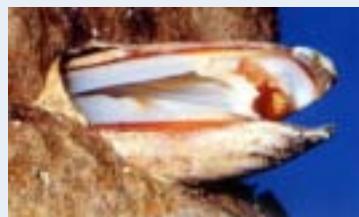
イガイに似た軟体部

潮間帯の堆積岩やサンゴに穴をあけて住む二枚貝で、大きさは5~6cmくらい、殻はずんぐりとして丸みがある。名前前からマテガイの仲間と思われるが、実はイガイの仲間である。そのため味がよく、浜のおかずの中では一級品といえる。古くから食用にされていたらしく、縄文時代の遺跡からも殻が出土している。石灰質の岩に酸を分泌して丸い穴をあけ、内側を石灰質の膜で保護した住みかを作る。このため、外側からは水管の穴しか見えず、写真のように石を割らなければ姿がわからない。浜の人は、横向きに穴に住む姿から「横つ貝」と呼ぶ。うまい表現だ。死んだ後、石の表面に残された直径1.5cmくらいの穴は、他の生物にとっても格好