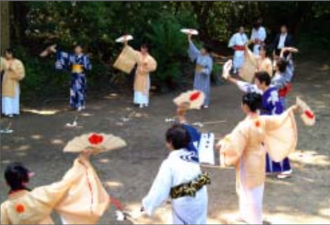
オンドトリの太鼓と歌にあわせて、輪になって扇を広げる「鹿島踊り」

高体連剣道専門部としても、1年生を対象に強化練習を行い、レベルアップをめざしていきます。今年のインターハイは長崎県福江市で開催され、私も視