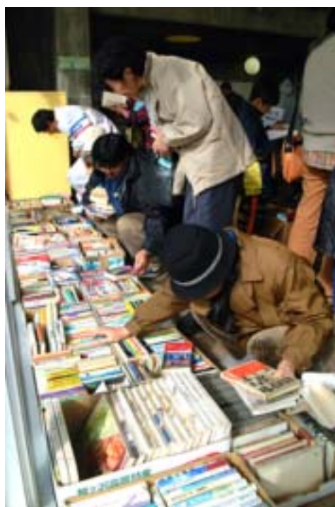
本のリサイクル市(昨年)

供していただき、欲しい人に譲ることで、本のリサイクルを進めます。昨年のリサイクル市には、約9千冊の本が集まりました。