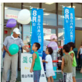
▲昨年の活動の様子