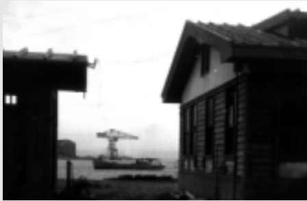
▲館山海軍航空隊水上機基地跡にあった起重機。戦後の昭和25・6年頃に撤去されたという。

な計画は、昭和21年3月に予定された関東平野上陸を目指すコソネット作戦でした。上陸地点は、茨城県の鹿島灘、県内の九十九里浜、神奈川県の相模湾からの3ルートが検討されていました。その関係資料には、地形、土壌、河川、道路や海岸線の状況、海の地形など、様々な観点からの検討が行われています。