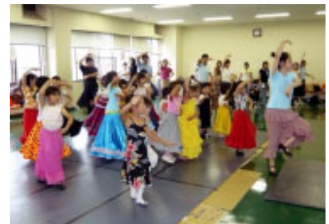
▲毎回盛況の親子フラメンコ教室