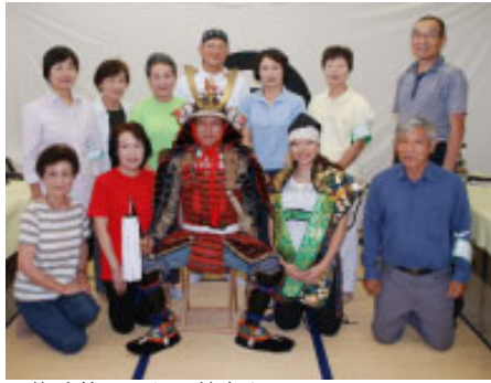
▲体験着用した入館者を囲む「甲冑士」のみなさん

市立博物館では毎週日曜日と祝日に無料で甲冑の体験着用を実施しています。平成2年に始めて以来、これまでにたくさんの入館者が体験しました。今年4月からはミュージアム・サポーター「甲冑士」が、ボランティアで体験着用のインストラクターを努めています。