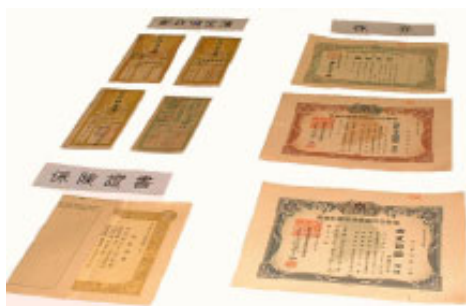
▲終戦当時の証券など

注意/当日の相談予約は受けません。相談は、直接面談で行います。相談者は、サラ金などへの振り込みの控え、カード、契約書などを持参してください。サラ金からの借入れで途中全額返済をしている場合でも、できるだけ古い資料を探してください。完済して残金0円の場合も同様です。 問合せ・予約/各司法書士事務所