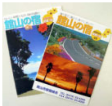
▲館山市旅館組合のパンフレット

補助対象事業/館山市に住所を有する民間団体やNPO法人などが行う事業で、観光関連施設の整備、新たな観光資源の開発または既存観光資源の魅力向上、新たな観光イベントの開発、新たな特産品の開発や