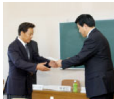
▲市長から諮問書を受ける羽山会長