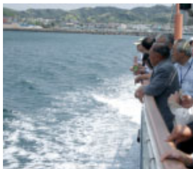
▲「たかしま」で洋上から視察

「棧橋が完成したらこのような景観を楽しむことができ。素晴らしい」といった意見が聞かれました。