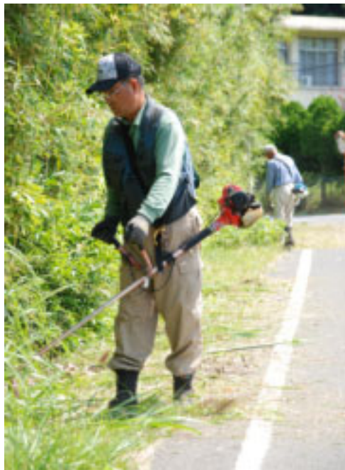
▲会員による草刈作業（面積が広いときには二人以上で作業します）

館山市シルバー人材センターは、草刈りや家事の手伝いなどの軽作業や、簡単な事務の手伝いなどを引き受けています。あなたの回りのちょっとした作業などお気軽にご利用ください。 問合せ／館山市シルバー人材センター（☎27-2799）