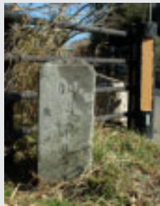
▲「明治三十九年」と彫られた親柱

巴橋は石造の橋で、大神宮側の親柱には、「明治三十九年」と彫られています。一九〇六年に建設されたこのアーチ橋は岩盤上につくられ、長さ11m、幅3mの大きさです。方形に整えられた比較的大きな地元産の凝灰岩質の砂岩を、目が横に通るように積み上げる布積(ぬのづみ)という工法