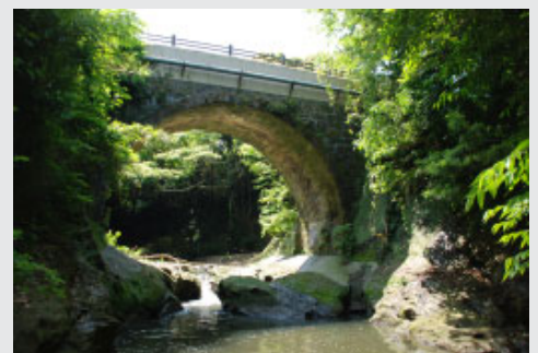
▲下流から見た巴橋

大正12(一九二三年)の関東大震災で、巴川を逆流した津波は、すごい勢いで巴橋を飲み込み、上流へと流れ込んでいったとされていますが、石積みのこの橋は、津波の勢いにも負けませんでした。また