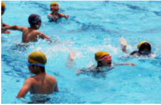
▲▼今年初めてのプールにおおはしゃぎの児童たち

プール開きに参加したのは、3年生以上の62人。水泳の授業を心待ちにしていた児童たちは、準備体操の後、先生の合図と共に一斉にプール