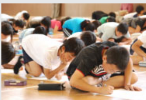
▲計算問題に挑戦する児童たち