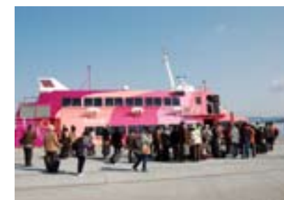
▲多くの乗客が参加(館山港)

今年には悪天候のため、土日を中心に欠航となった日が多かったものの、3月11日までの前半の利用人員は、昨年度に比べ1千人増の状況です。市外から544人の利用者も増え、カラフルな船体は春の鏡ヶ浦の風物詩になっています。