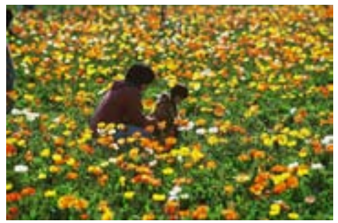
▲第9回館山観光写真コンクール（平成13年実施）最優秀賞 房総の楽園

館山市内の四季折々の自然、史跡、産業、行祭事など館山らしさの風景写真を募集します。