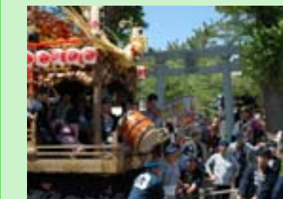
▲しゃくやくまつり