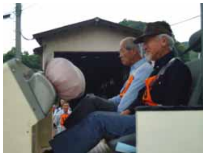
衝撃のショックを体験する参加者

りでは、「普段、何気なく車で通り過ぎるけど、結構、歩道が狭い。ここは見通しがよく、スピードもでちやうどのに」と気づいた点を書きとめていました。 点検後、各班で気づいた箇所を取りまとめ、意見を集約し、連合会が、交通安全マップを作成します。マップの完成予定は、3カ月後で、できあがったマップは、学校や町内会などに配布され、事故防止を呼びかけます。