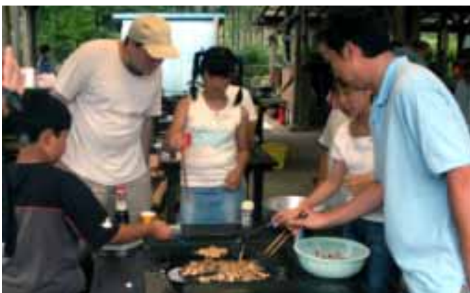
メキシコチームの夕飯のしたく

参加者は「煮物に豆板醤を少し入れるだけで、味がしまるんですね。ちょっとしたアイデアなんです。さすがはプロ。家でも試してみます」と話していました。この教室は全4回で、8月に「手軽に楽しむイタリア料理」、9月に「和風オードブル」、10月に「寿司」が開催され、その都度、受講生を募集します。