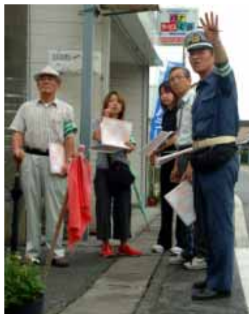
大通りの歩道に立って車の速度を体感する交通指導員やPTAなど

んでいる市町村内で事故を起こし、さらに近隣市町村での事故は約2割。交通事故の約7割は、自分の住んでいる市町村や身近な地域で発生している結果がでています。県交通安全対策課では、地