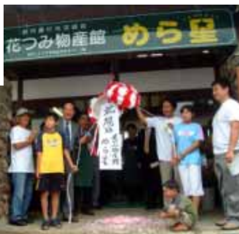
オープニングのクス玉割

は、駐車場整備に210万円を補正予算に計上し、まちづくり塾をバックアップしています。