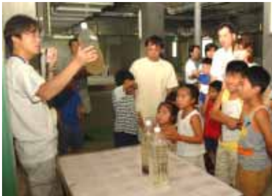
昨年の見学会の様子

参加費／無料 申込み／電話、FAXまたはEメールで(電話での申込は土・日曜日は除きます)住所、氏名、参加者(大人・子ども)の数、学校名、希望時間(午前・午後)、電話番号を連絡ください。当日受付可。 問合せ／下水道課(22-3661 FAX24-5621)