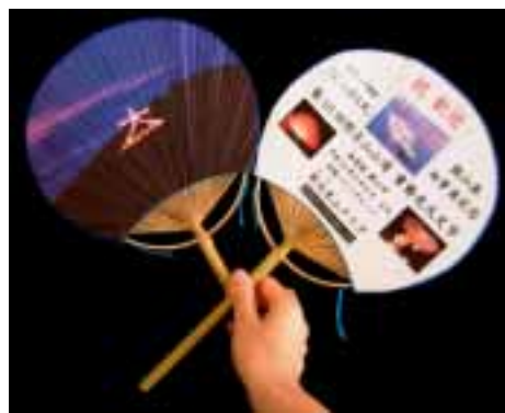
「にっぽん丸の乗船客に配られるうちわ」

那古寺の住職といっしょに地元の仲間、京都に行った時に大文字焼きを見て、那古でもやるよって話がきっかけです。火事を起こしたら大変なんで、電飾でやることにしました。最初は、支柱に使う電信柱をもらってきたり、ロープなどもメンバーが持ち寄っていました。電球の資金もみんなを出し合いました。 電飾は、高さ約16m、幅約14.5mで、電信柱を十字にして、配線をロープに巻きつけています。60wの電球を50個使っています。 今年は10周年。ちょうど花火の夜に「にっぽん丸が来るというので、記念事業として、房州うちわをプレゼントすることにしました。 10年一区切りと続けてきました