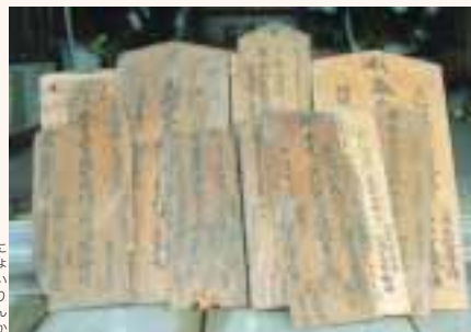
神余の原の堂に残る棟札

の28戸が信仰する如意輪観音を祀ること、このお堂に住む堂守がいたことなどもわかります。 棟札は、このお堂がどんな歴史をたどってきたのかを知る手がかりになるわけですが、それだけでなく、江戸時代の神余地区の領主が誰だったのか、名主・組頭などの地区の世話役が誰だったのか、どの誰が大工や木挽として活躍したのかなども分かります。江戸時代の地域社会の様子を知る重要な手がかりにもなっています。 棟札が残されることで、こんな小さなお堂からでも、地域の歴史を明らかにしていくことができます。