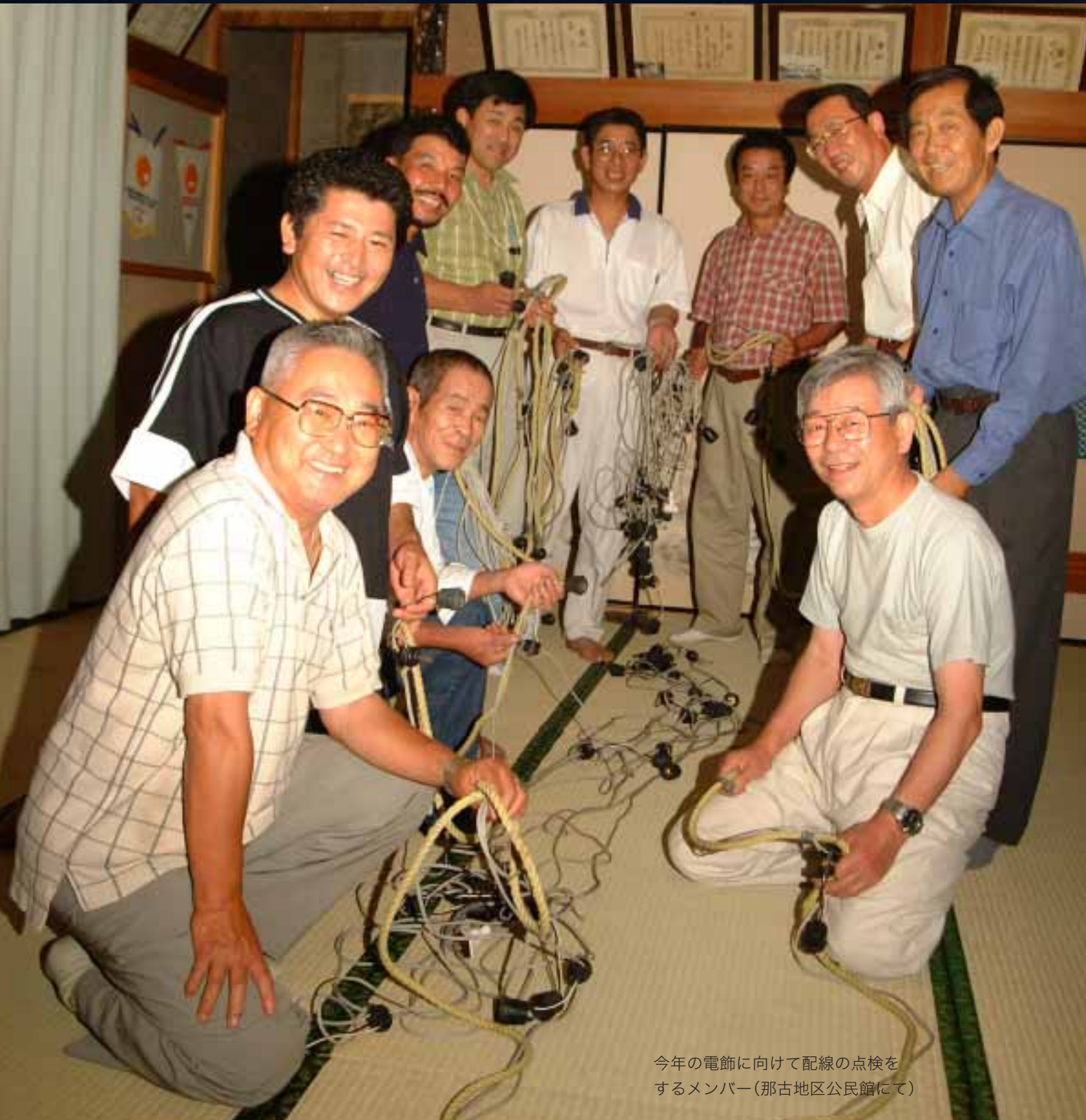
今年の電飾に向けて配線の点検をするメンバー(那古地区公民館にて)

シリーズ 市民 175 「みんな手弁当でよくやりますよ。地域のためになるならうれしいですね」