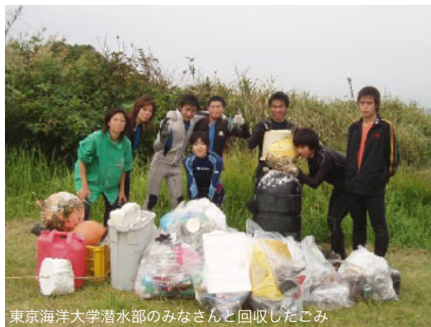
東京海洋大学潜水部のみなさんと回収したごみ

坂田に実習場がある東京海洋大学潜水部の生徒のみなさんが、秋の散乱ごみゼロ週間に先駆け、日頃、部活動でお世話になっている坂田海岸の海中の美化活動を行いました。器材をつけ、海の中にあるポリタンクやペットボトル、空き缶などを回収しました。