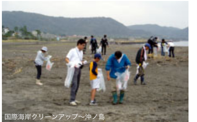
国際海岸クリーンアップ～沖ノ島

坂田に実習場がある東京海洋大学潜水部の生徒のみなさんが、秋の散乱ごみゼロ週間に先駆け、日頃、部活動でお世話になっている坂田海岸の海中の美化活動を行いました。器材をつけ、海の中にあるポリタンクやペットボトル、空き缶などを回収しました。