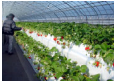
▲観光いちご狩りの高設栽培施設

市は、観光振興支援事業補助金制度を設け、民間団体などが行う観光振興事業を支援し、魅力的な観光地づくりをサポートしています。