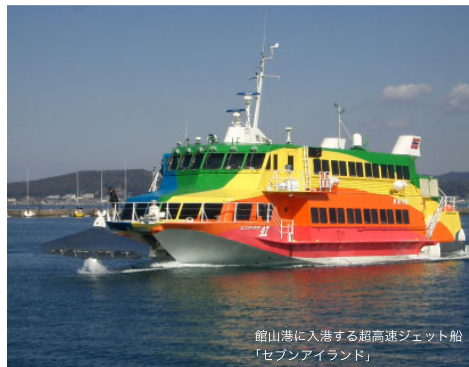
館山港に入港する超高速ジェット船「セブンアイランド」

伊豆諸島との航路を運航する東海汽船(株)では、来年も2月5日から3月11日まで東京から館山～大島～下田を結ぶ航路を、また3月12日から4月1日まで東京～館山～大島を結ぶ航路を運航します。ポピーや菜の花彩る「南房総館山」から椿香る「伊豆大島」、河津桜や水仙が咲き乱れる「伊豆下田」まで、超高速ジェット船で行く海の旅をお楽しみください。