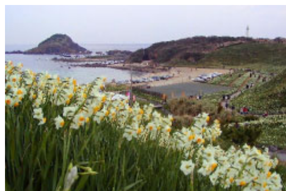
▲爪木崎の水仙(下田市ホームページより転載)

問合せ/東海汽船株式会社 運航について:営業課 ☎03-3436-1144 予約について:予約センター ☎03-5472-9999