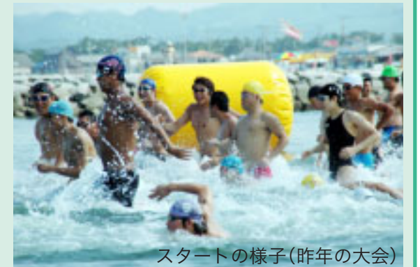
スタートの様子(昨年の大会)