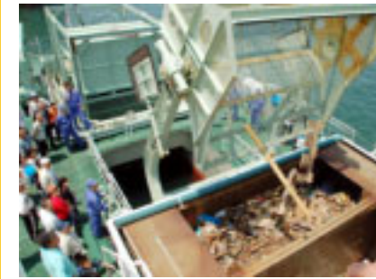
「べいくりん」に見学者が殺到

先月開催された『たてやま海まちフェスタ2006』では、約3千500人が用意された18のアトラクションに参加、乗船体験や船内見学会、ミニライブ、魚の話などで「海」を満喫しました。今年は、シーカヤックの乗船体験や東京湾の美しさを守り続ける国土交通省の清掃兼油回収船「べいくりん」の船内見学など初めてのアトラクションも加わりました。「べいくりん」のごみ回収のデモンストレーションでは、見学者もその威力に感心しきり。