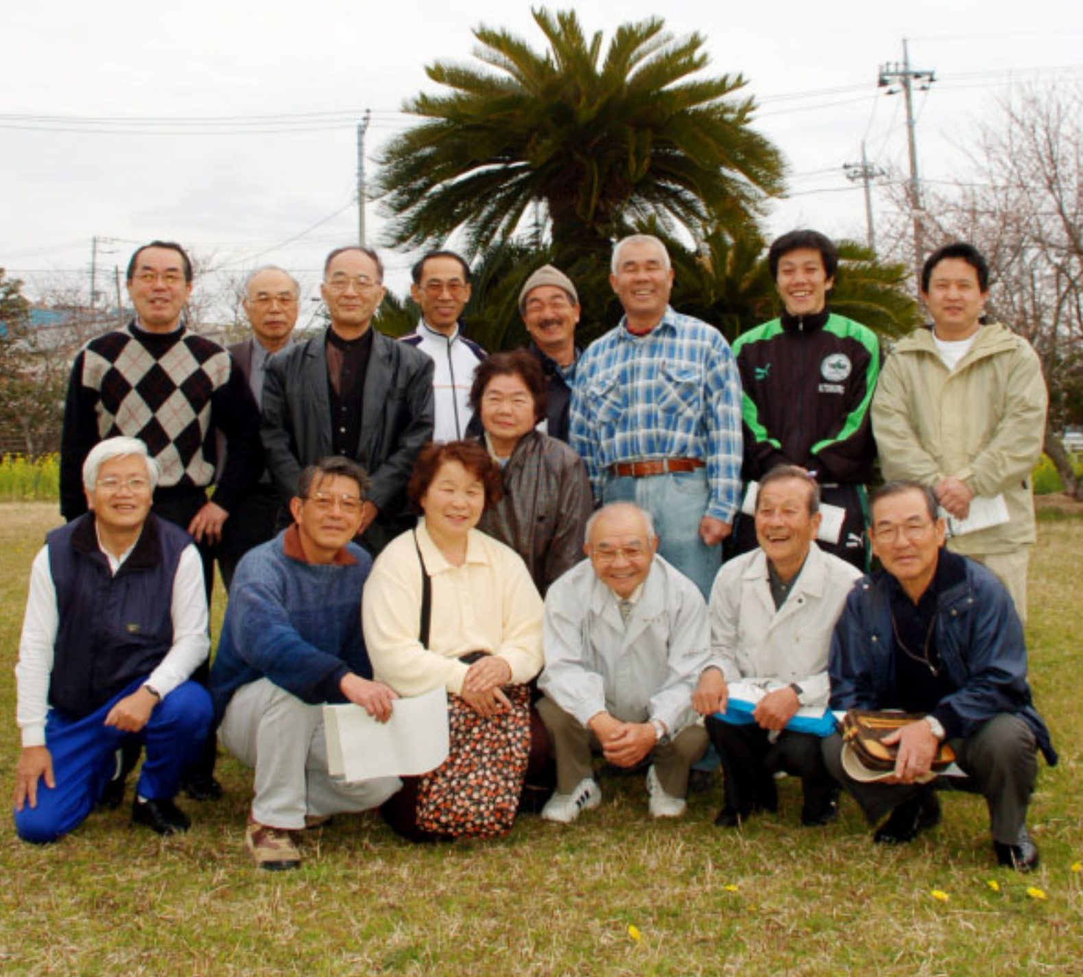
“いつでも・どこでも・だれでも・いつまでも”