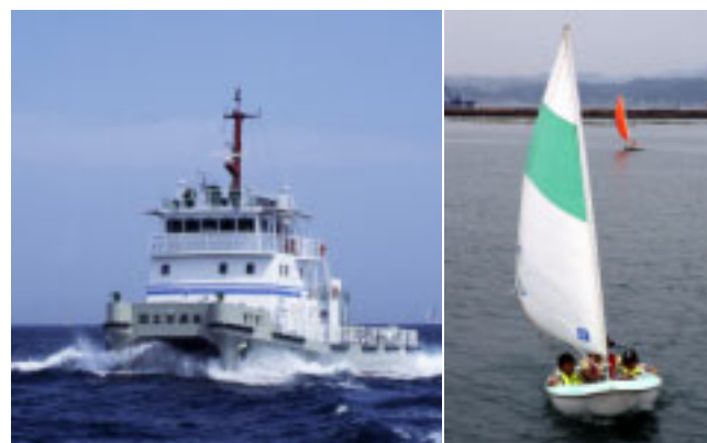
▲海を守る船「べいくりん」(左)とアクセスディンギー(右)