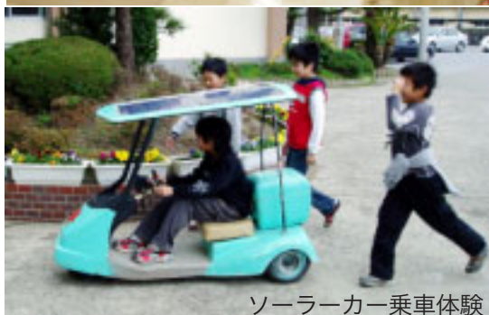
ソーラーカー乗車体験