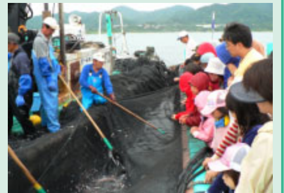
観光定置網の様子