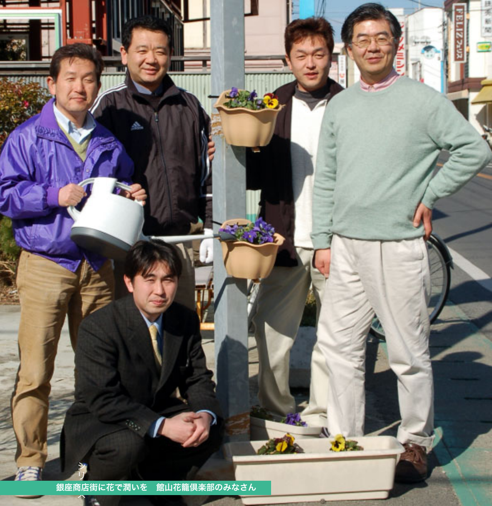
銀座商店街に花で潤いを 館山花籠倶楽部のみなさん