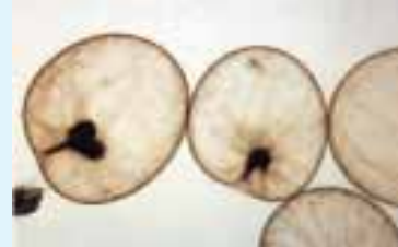
ヤコウチュウ(径約1mm、顕微鏡写真)