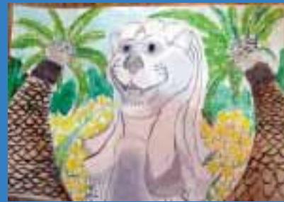
新井 健(館野小6年)君 講評/構図が良く、ていねいに描かれています。