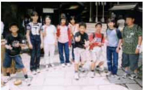
御成小の3人と一緒に「れきしーず」(銭洗弁天)

がなかったら今の生活はありませんね。今回の受賞は、先代や今の組合員はじめ、この林に携わった人全員にいただいたもので、たまたま私が代表しただけ。これからも砂防林を守っていききたいですね」