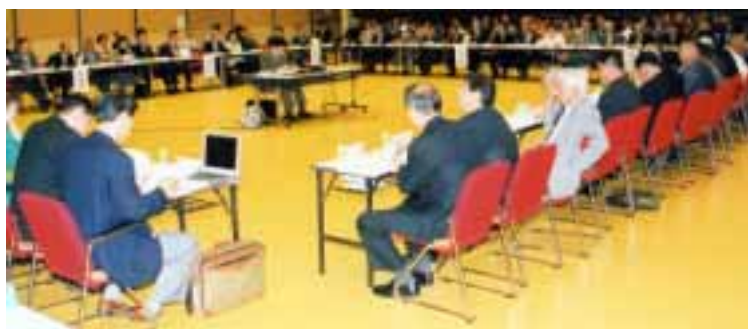
当日60人の委員が出席し協議

らかにし、新市のあるべき姿と基本的な施策の方向性を示し、新市の市政運営の指針とします。また、策定に当たっては、住民の意見を十分勘案するとともに、時代の要請を考慮し、合併後10年間について