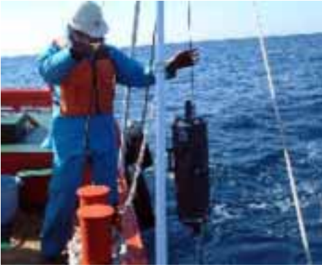
昨年の取水作業(洲崎沖)

市では、南房総特有の地域資源を活用した地場産業の活性化、新規産業の開発などを支援するため、平成13年度か