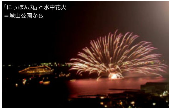
「にっぽん丸」と水中花火 =城山公園から

館山湾を活用した地域の活性化を推進している市では、館山港利用促進の一環として、大型客船などの寄港に係るポートセールスを展開しています。この8月8日(月)には、館山湾花火大会の見学を目玉に、「にっぽん丸」が41人もの乗客とともに、3回目の寄港をしました。 問合せ/海辺のまちづくり推進課(☎22-3606)