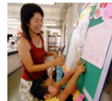
▲社会福祉課前に設置された掲示板