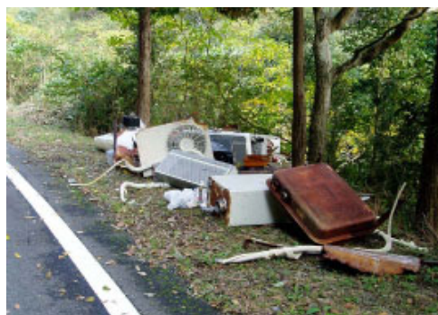
実際の不法投棄現場=市内