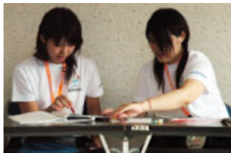
▲一般観覧者の車の誘導(コミュニティセンター駐車場)