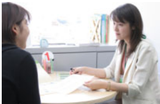
▲キャリアカウンセラーによる個別相談

この「ジヨブカフェちば」が、9月29日を皮切りに、市役所で開催されます。就職したいけれど方法がわからない、自分のアピールポイントがわからないなどの疑問に、専門のキャリアカウンセラーが答えます。相談は無料ですが、事