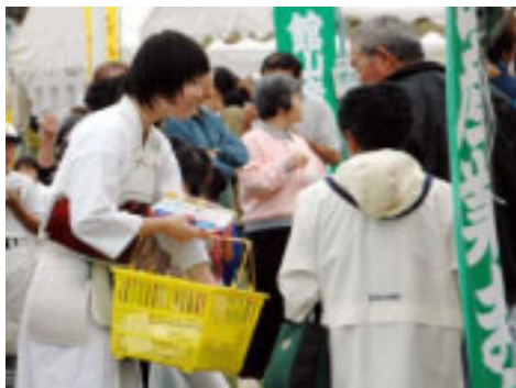
▲大会300日前推進キャンペーン

大会期間中の3日間は、毎朝午前6時20分に体育館に集合し、各自が担当する場所へ移動して、業務を行いました。駐車場など屋外の業務を担当した生徒たちの顔は、日に焼けて真っ黒に。誰にでも礼儀正しく一生懸命仕事に取り組む生徒たちの姿は、大会の関係者や応援の人たちから、高く評価されました。大会の全てが無事終了し、実行委員会から生徒たちに感謝の言葉が送られました。大会が終わって、生徒たちはようやくいつもより少し短めの夏休みを迎えることができました。