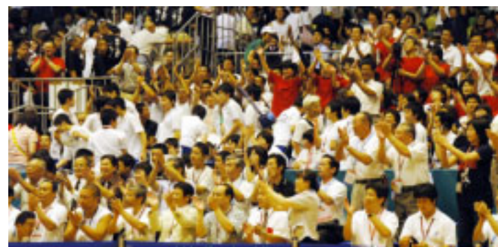
▲優勝が決まり、観客席から大きな拍手が送られた

「一番の勝因は、何より会場の大声援でした。声援が、子どもたちに勢いを与え、優勝することができたのだと思います。」 平成14年に安房高に赴任してから丸3年、剣道をする環境、あたたかく見守ってくださったOBの皆さん、そして本当に勝ちたいと強い意志を持った子どもたちに恵まれます」と所監督。 休むまもなく大会の翌日から道場で練習を開始した剣士たち。彼らが優勝の余韻に浸るのは、もう少し先になりそうです。