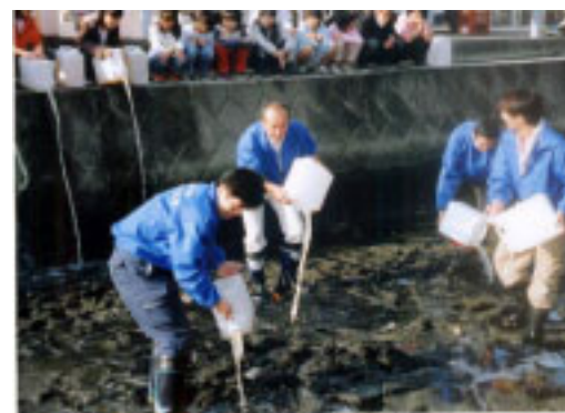
子どもたちも加わって浄化活動＝宇田川

会のメンバーが行った地元の船形小学校の授業をきっかけに、日曜日の投入活動には地元の子どもたち