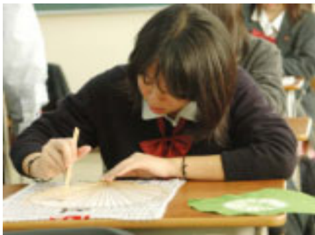
▲歓迎の気持ちを込めたうちわの作製