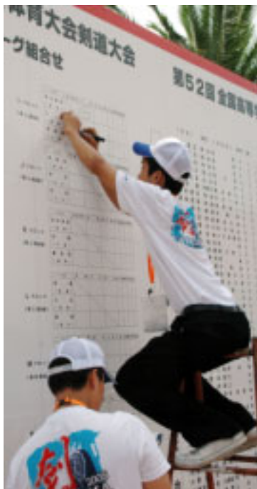
▲トーナメント表に結果を記入