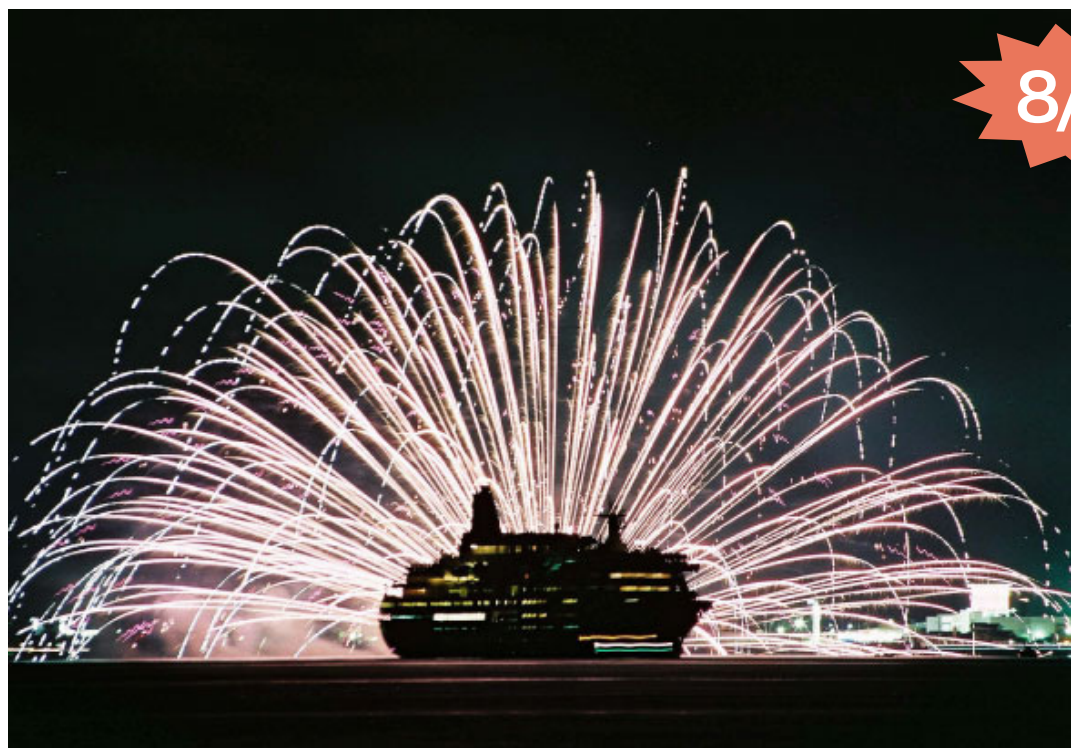
昨年のにっぽん丸と水中花火(館山湾花火大会)

昨年に続き、商船三井客船(株)所有の客船「にっぽん丸」(総トン数2万1千903t、船客定員532名)が、8月8日(月)の館山湾花火大会当日、館山港へ寄港します。 今回は、横浜港を出発して館山湾花火大会を観覧するワンナイトクルーズ。午後3時に横浜港を出港し、午後5時30分ごろ鏡ヶ浦にその美しい姿を現します。 館山湾の海上から見る花火、中でも水中花火の美しさと迫力が評判を呼んだことから、今年も館山湾花火大会