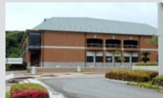
▲会場となる県立館山運動公園体育館

・臨時駐車場の開門は午前6時30分。無料シャトルバスが午前6時40分から5～15分間隔で運行します。(試合時間により運行を延長)