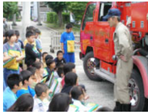
▲消防団員を質問攻め