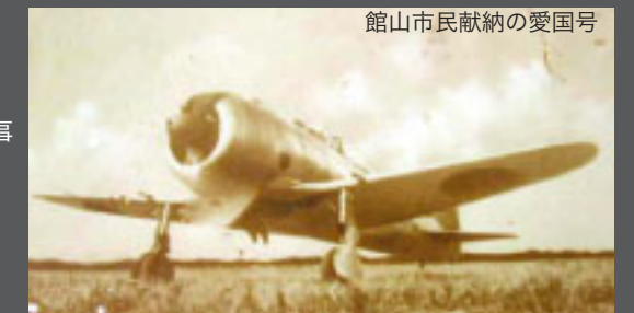
館山市民献納の愛国号

博物館の収蔵資料から、戦争当時のくらしや出征兵士、軍事施設に関する資料を展示、軍都としての館山を紹介します。 期間/7月23日(土)～8月31日(火)【月曜日休館】 場所/館山市立博物館 問合せ/市立博物館(☎23-5212)