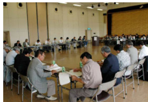
第2回観光立市たてやま推進協議会