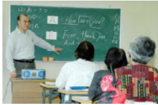
▲2回目の英語の授業

授業ではまず、国語の大事な「聞く・話す」の実践として生徒自ら自己紹介を行い、その後、今年の高校入試の漢字の問題を出題。「最近の人はへんやつくりを知らない。なべぶたと電話で言った、理解してもらえませんでしたなどとエピソードを披露しながら、テンポよく授業を進めていました。