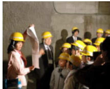
▲赤山地下壕内でガイド

曲「ウミホタル」コスモブルは平和の色』の初演コンサートの開催を千葉県南総文化ホールで予定しています。その際、明治時代にアメリカに渡った房州のアワビ漁師の歴史から、地域の自然環境と戦争にまつわる相互交流の歴史を日米両国から見つめ直すシンポジウム「平和・交流・共生」も開催します。