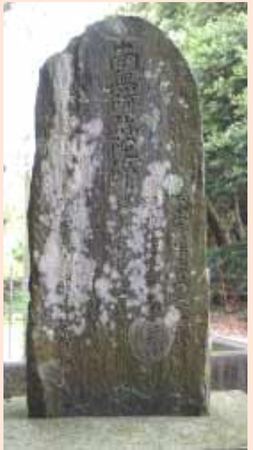
千葉寺門前の「佐野洞穴出土人骨弔魂碑」

このことは、昭和2年(一九二七)になって、当時千葉県が刊行していた『史蹟名勝天然記念物調査』という雑誌に報告されています。その雑誌には2体の完全な姿の頭蓋骨写真も載せられました。人骨のほかには貝製の装飾品も数点出土していて、4点分の図も合わせて載せられています。 出土した場所は白萩(しろはぎ)というところで、そのむかし岩見堂というお堂があったところでした。そこは水田に面した山すそで、