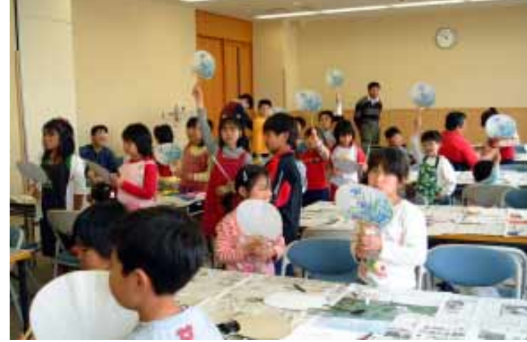
▲手づくりうちわの完成にニッコリの子どもたち