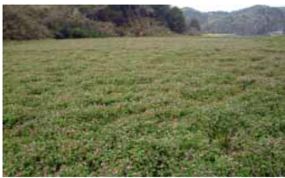
▲那古の葛原集落の景観形成作物(レンゲ)の作付

館山市商店会連合会では、6月17日から7月7日まで、連合会に加盟している9商業会、約400の事業所で「たてやま商業まつり」を開催します。期間中、参加加盟店では、千円ごとに1枚三角くじをプレゼント。その場で当たりがわかり、参加加盟店でそのまま金券として、利用できます。当たりは、100円が1万2千本、500円が千200本、千円が千200本、5千円が200本で、総額400万円。金券として利用できる期間は6月17日から7月31日までです。