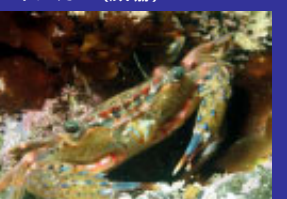
▲ベニツケガニ(小型美麗種)