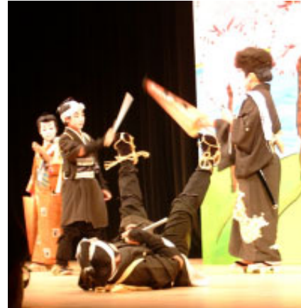
▲捕手に囲まれる場面

会設立準備会を経て昨年11月に保存会を設立。今年1月から3月まで「子ども歌舞伎教室」を開催し、伝統芸能の基本であるお辞儀や歩き方、化粧などを学んだ。このときの参加者を中心に「白浪五人男 瀬川勢揃いの場」を先月16日の南総里見まつりフォーラムで上演した。