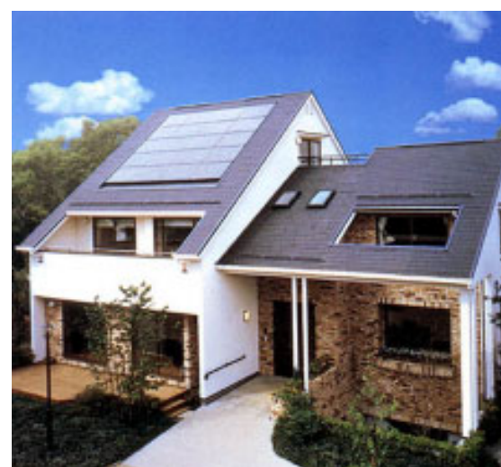
住宅用太陽発電を設置した住宅