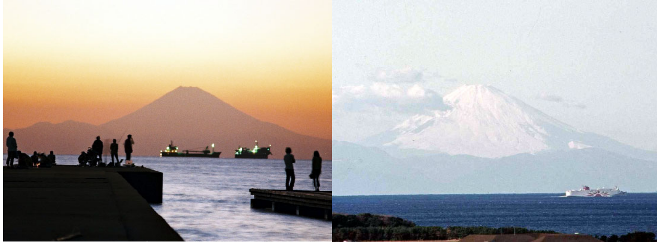
▲北条海岸からの夕景