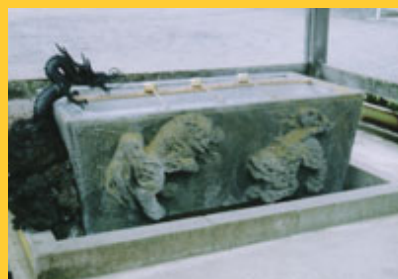
小塚大師の「手水石」