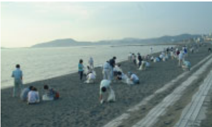
きれいな環境を(鏡ヶ浦クリーン作戦)

市では昨年3月に、国の「地球温暖化対策の推進に関する法律」により、館山市地球温暖化対策実行計画(たてやまエコ・オフィスプラン)を策定し、率先して地球温暖化の防止に取り組んでいます。また、市民や事業者にも自主的に取り組んでもらうよう要請しています。計画では、地球温暖化に影響を及ぼすCO 2 (二酸化炭素)など温室効果ガスの排出抑制を主たる対策とし、これを伴う市の事務事業における活動について、平成15年度から19年度の5年間で、温室効果ガスの総排出量を12年度と比べて6.0%以上削減することを目的としています。