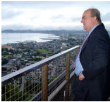
博物館分館から市内を視察する コンデ駐日スペイン大使

駐日スペイン大使のハビエル・コンデ氏がこの夏、南欧風のまちづくりやフラメンコフェスティバルなど、スペインと深い関わりのある館山を訪問されました。市役所を訪れた大使は、辻田市長、秋山市議会議長、伊藤助役と懇談。館山の南欧風まちづくりについての意見交換を行いました。