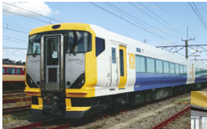
▲新型特急E257 さざなみ号

10月のダイヤ改正で、長年親しまれた、クリーム色に赤の帯をあしらった特急「さざなみ」の車両が、内房線の定期運行から姿を消すことになりました。この車両は昭和47年7月に、君津までの複線化、房総西線から内房線への改称と同時に、増え続ける首都圏からの旅客に対応するため導入し、32年にわたり市民の千葉・東京方面