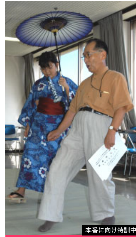
本番に向け特訓中