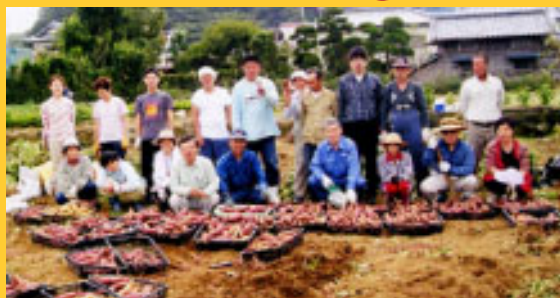
たくさんとれたよ(昨年の収穫の様子)

また、障害者の自立の一環から、作業所の近くに支援者より借りた畑でさつまいもを栽培。作業を通して障害者のケアを進めています。今月29日には北条公民館の主催事業「遊ぼう!1・2・3歳児に畑を開放。収穫したさつまいもを販売し、会の運営費に充てていきます。12月には、普及啓発活動として鴨川市で開催されるセミナー「心の健康のつどい」に、会長が実行委員長として参加します。