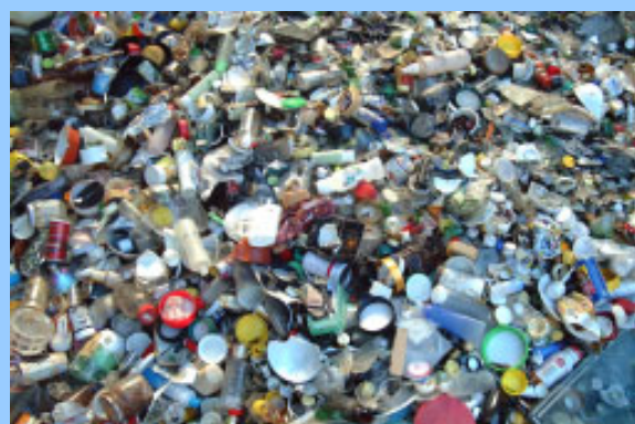
ガラス類の日 に混じっていたガレキ類。 これらは本来「金属類の日」に 出されるはずだが...

王冠、アルミキャップ、化粧品の 入っていたびん、耐熱ガラス、せと ものなどは「金属類の日」に、プラス チック製のキャップは「燃せるごみ の日」に出して!