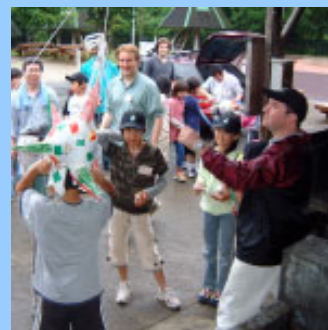
ピニャータで遊ぶ子どもたち

メリカに分かれて4チームを編成し、各国の料理などにチャレンジ。夕食後は、チームごとに個性的なピニャータを飾りつけました。ピニャータは、メキシコのクリスマスや誕生日に行われる伝統的な遊びで、装飾した紙の張りぼてを数日間飾り、祝いの日に棒でたいて割ります。中から、