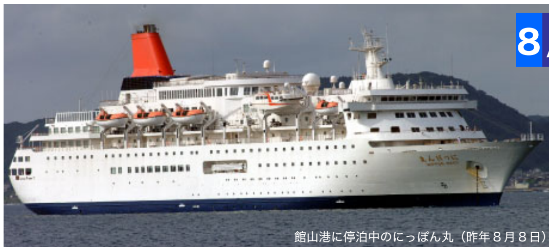
館山港に停泊中のにっぽん丸（昨年8月8日）

5月の「飛鳥」に続き、昨年と同様に商船三井客船株式所有の客船「にっぽん丸」(総トン数2万1千903t、船客定員532名)が、8月8日(日)花火大会当日、館山港へ寄港します。 今回は、「東北三大祭と館山花火大会クルーズ」として、秋田竿燈祭り、青森ねぶたまつり、仙台七夕まつりを見学。帰路、館山に寄港し、館山花火大会を見学するコースで実施されます。横浜から乗船し、館山で下船する『東北三大祭クルーズ』で参加した場合、通常代金より15%割引の、南房総エリア特別料金が設定されています。 市では今後も、客船・帆船など多様な船舶の寄港による地域活性化を推進する、館山港を中心とした「海辺のまちづくり」に取り組みしていきます。 問合せ／海辺のまちづくり推進課(☎22-3606)