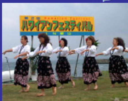
昨年の大会の様子

全国からフラダンス愛好家が館山に集まります。今年はハワイ・ホノルル市から本場のフラダンサー、ハワイアンバンド約20人も来日出演し、大会に花をそえます。